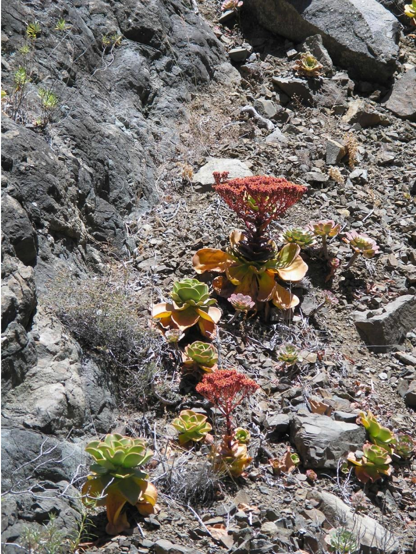
Aeonium nobile in bloei in de Barranco de las Angustias. Dit is de enige roodbloeiende Aeonium en hij groeit alleen op La Palma.