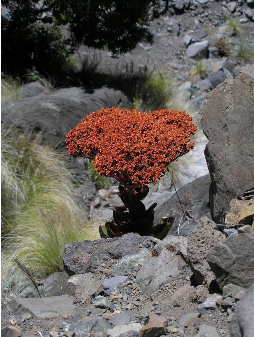
Aeonium nobile op La Palma (zie verderop in dit blad).