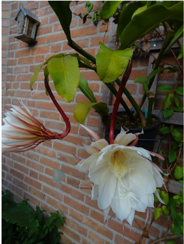
De epiphyllum oxypetalum staat vrijdag nog steeds te bloeien