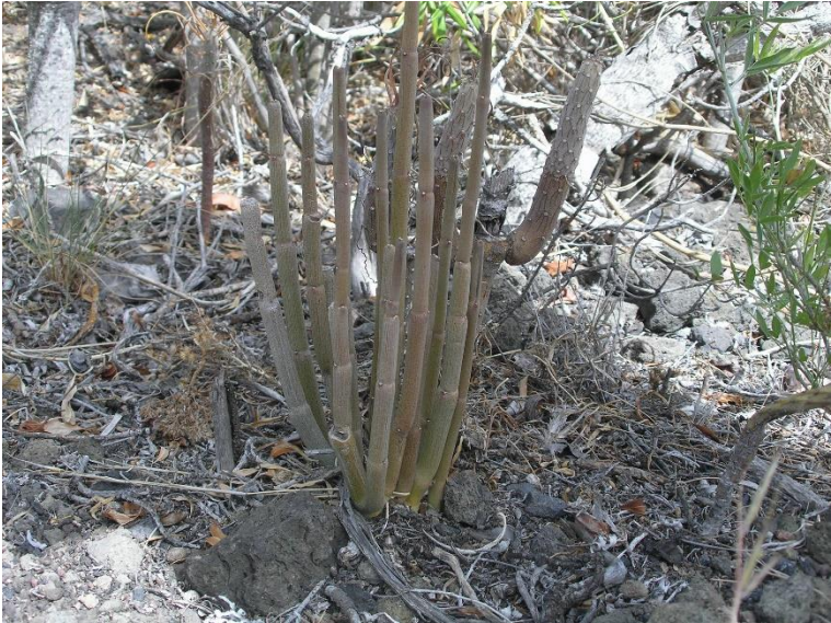
Nog een Ceropegia.