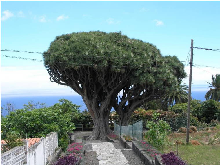
Oude exemplaren van Draecano draco (de drakenbloedboom) kom je niet zomaar tegen op La Palma, maar gelukkig verwijst het toeristenboekje naar dit duo in Breña Alta. Er hoort een suffe legende bij, misschien is dat de reden dat ze gespaard zijn gebleven.