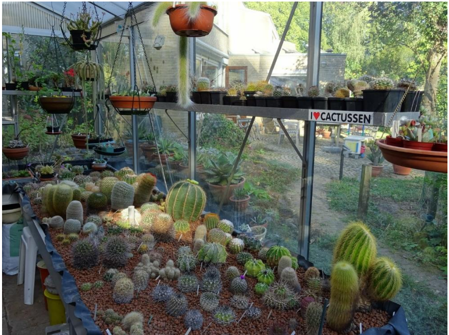
Een doorkijkje vanuit de kas naar de tuin van Riet