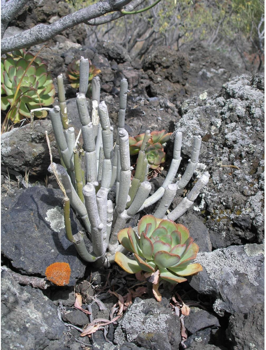
Ceropegia langs de weg naar de zuidpunt. Waarschijnlijk C. hians . Sommige taxonomen rekenen deze soort nu tot Ceropegia dichotoma (die geel bloeit), andere vinden het toch een aparte soort. Omdat er geen bloeiende plant te vinden was, blijft het onduidelijk.