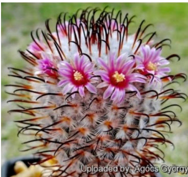
Uploaded by Agócs György

Dit betreft Mammillaria perezdelarosa op 1 mei bij mij in bloei !