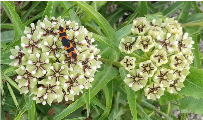
Asclepias asperula met links 2 stuks Oncopeltus fasciatus op bloem.