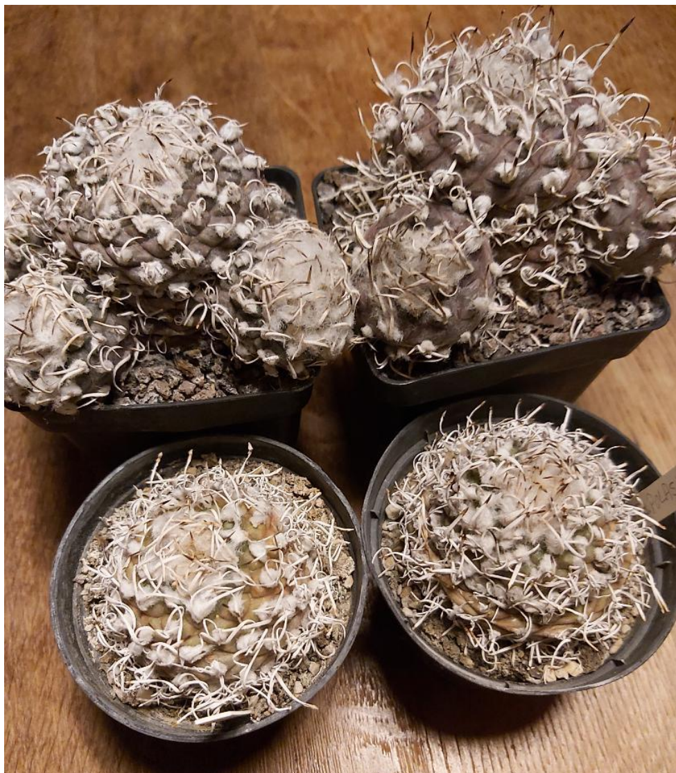
Foto van Jan van Dijk met de naam Turbinicarpus polaskii en opmerking “op lava of grond “. Gezien de steentjes lijken deze plantjes gekweekt op/met lava grind (Red.)