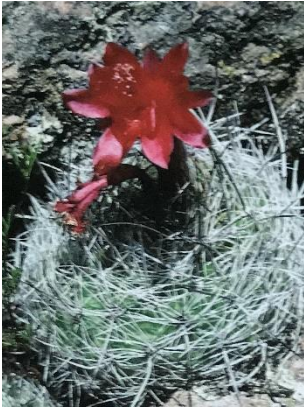
Matucana haynei ssp. hystrix .

In ons afdelingsnieuws van 27 januari 2021 staat bij het artikel over de determineerplant 1 e kwartaal 2021 dat mede gezien de moeilijkheidsgraad de winnaar zal worden beloond. Voor elk van de drie winnaars (zie maart-nummer) is een klein plantje (zie foto) ter beschikking gesteld door fam. van Gijs, te weten Matucana haynei ssp. hystrix .