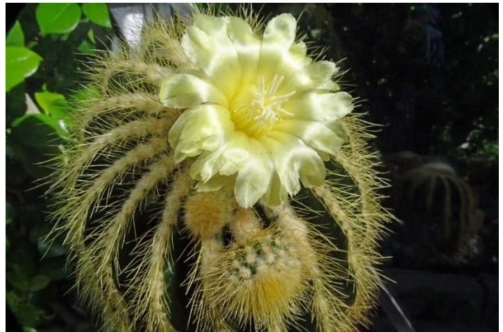
Notocactus magnificus = Eriocephala of Parodia magnifica

Deze Notocactus heb ik al jaren in mijn kas staan. Als klein plantje ooit gekocht is momenteel uitgegroeid tot een statige cactus van 35 cm hoog . Een dankbare cactus die ieder jaar weer mooie gele bloemen laat bloeien. Vijf bloemen heb ik dit jaar mogen bewonderen. De eerste in juni en de laatste van de vijf in augustus.