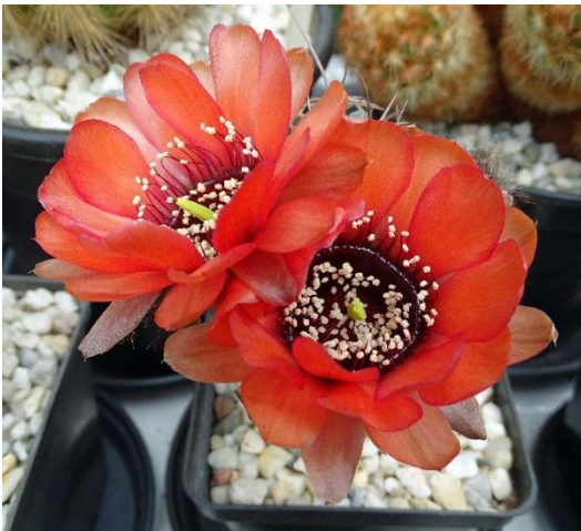
Lobivia jajoana = Echinopsis jajoana

De bloemen van deze Lobivia zijn vrij groot ten opzichte van de cactus. De kleur van de bloem kan variëren van rood-geel-oranje tot violet. Mijn Lobivia is oranje en zoals de meeste hebben deze bloemen een heel donker tot zwart hart. De cactus heeft in juni met twee bloemen gebloeid.