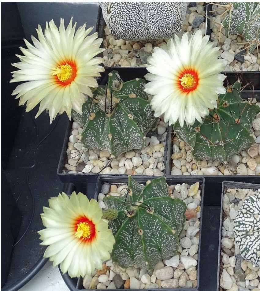
Astrophytum capricorne (A.Dietr.) Br.& R. 1922

De Huernia is een succulent uit de maagdenpalm familie. Het is een langzaam groeiende plant die in het oosten en westen van Afrika groeit. De imposante bloem is rood met gele strepen en heeft een verhoogde band om het hart zitten. De bloem bloeit wel een hele week lang. De Huernia bloeit later dan de cactussen. Zij bloeit pas in september en oktober. Zo heb ik in het najaar nog steeds mooie bloeiende planten in mijn kas staan.