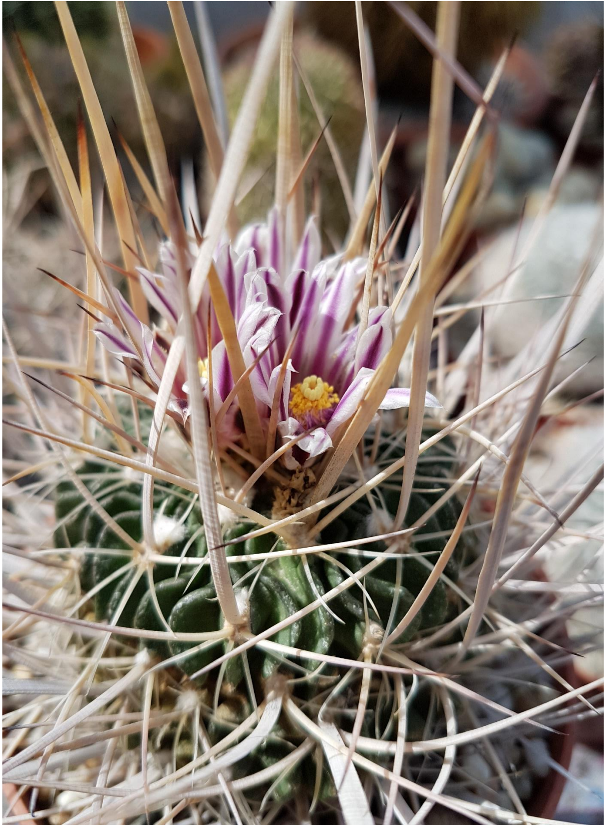
Echinofossulocactus met mooie, lange dorens