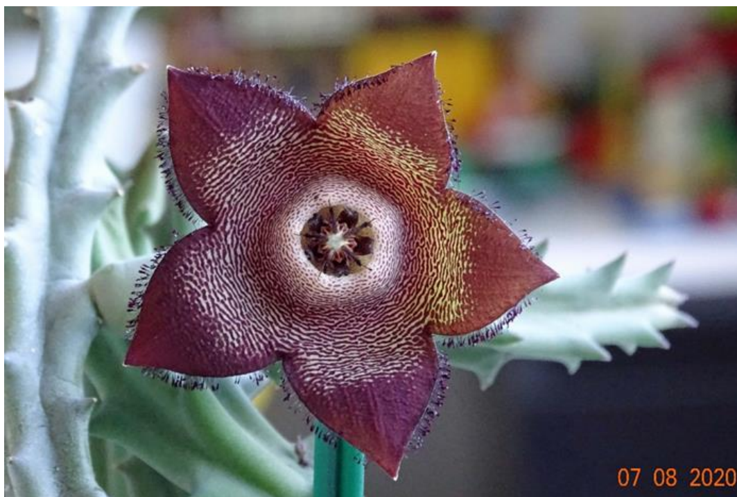
Stapelia tromotriche ligridia. = Stapelia tigridia Decne. = Tromotriche revoluta (L.) Haw.