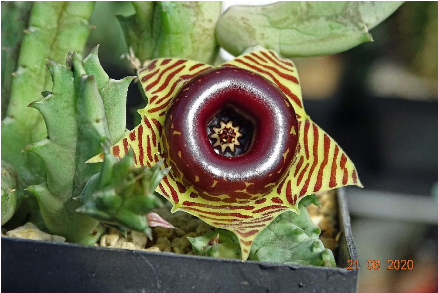
Huernia zebrina N.E.Br.

De Huernia is een succulent uit de maagdenpalm familie. Het is een langzaam groeiende plant die in het oosten en westen van Afrika groeit. De imposante bloem is rood met gele strepen en heeft een verhoogde band om het hart zitten. De bloem bloeit wel een hele week lang. De Huernia bloeit later dan de cactussen. Zij bloeit pas in september en oktober. Zo heb ik in het najaar nog steeds mooie bloeiende planten in mijn kas staan.