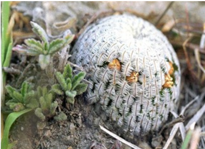
Zoals de plant op internet te zien valt.....