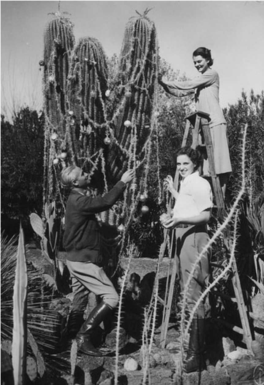
iets voor Kerst? .....