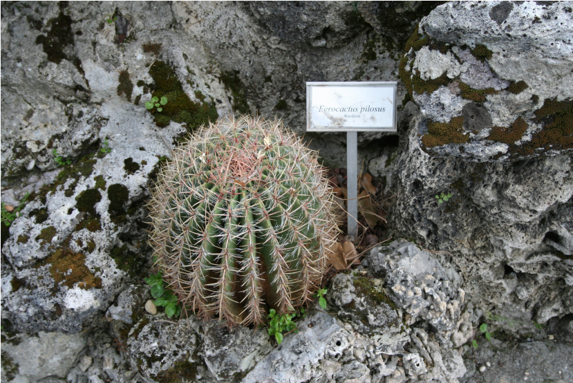
Pauselijke tuin, Vaticaanstad