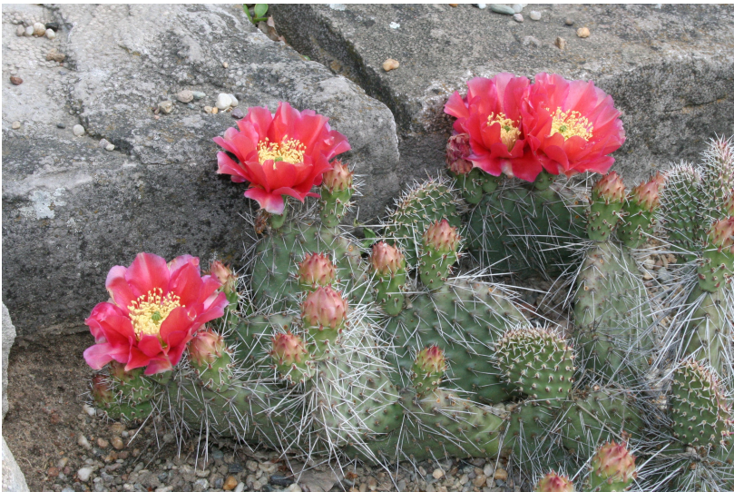
Opuntia polyacantha , Botan. Tuin Berlin-Dahlem

een Ferocactus pilosus (althans volgens het bordje)