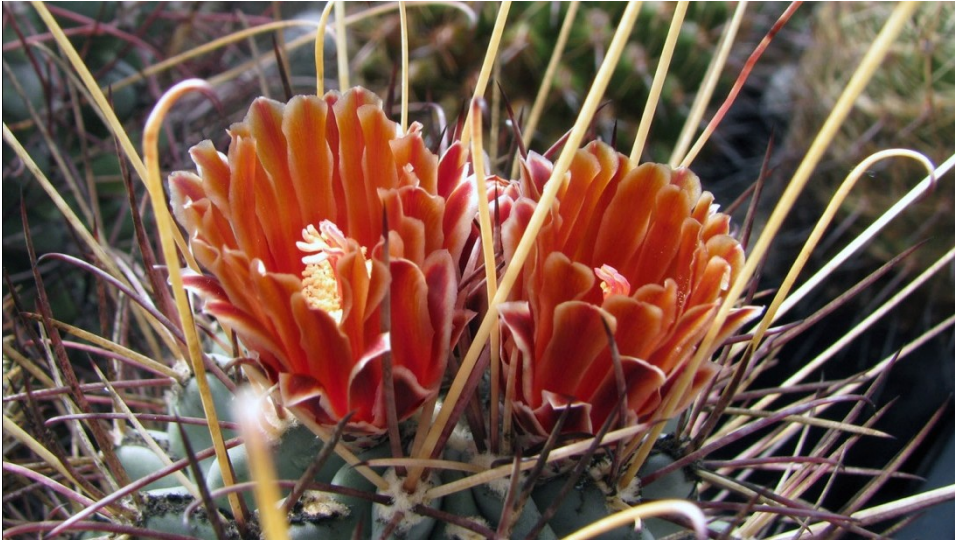
Sclerocactus uncinatus ssp. uncinatus bij Specks in Duitsland

Ik ben met Cactusweelde uit Turnhout mee geweest naar Duitsland en het is me uitstekend bevallen. Als de kans er is zou u ook eens mee moeten gaan.