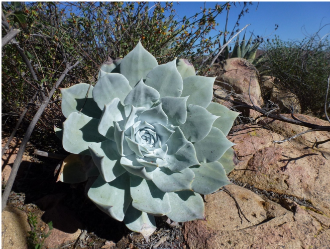
Dudleya cultrata (foto uit de lezing van 3 mei)

Gewoon als u iets speciaals opvalt aan een plant of waarom een bepaalde plant uw favoriete plant is.