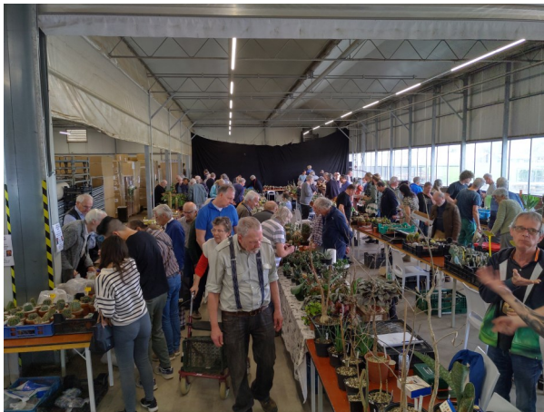
Overzicht van de beurs

Al met al weer een zeer geslaagde open dag.