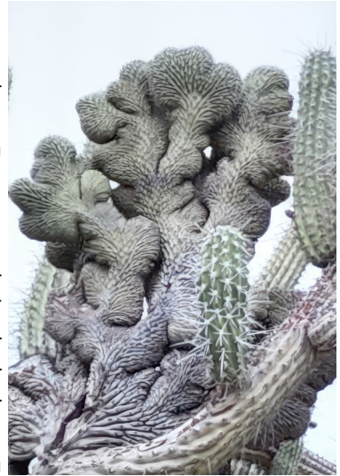
cristaat van Stetsonia coryne

Na de pauze beginnen we bij La Rioja en zien eerst een foto van de nandus (een soort struisvogel). Ze bezoeken het nationale park Talampaya, wat uitsluitend onder begeleiding mogelijk is). Op weg naar Chilicito zien we o.a. Tephrocactus alexandri , Gymnocalycium saglionis en Trichocereus terscheckii . Op weg naar Concepción zien we op 1 gebied: Gymnocalycium schickendantzii , catamarcense , weissianum en mazanense en Pyrrhocactus bulbocalyx . Daarna zien we een cristaat (zie foto) van Stetsonia coryne .