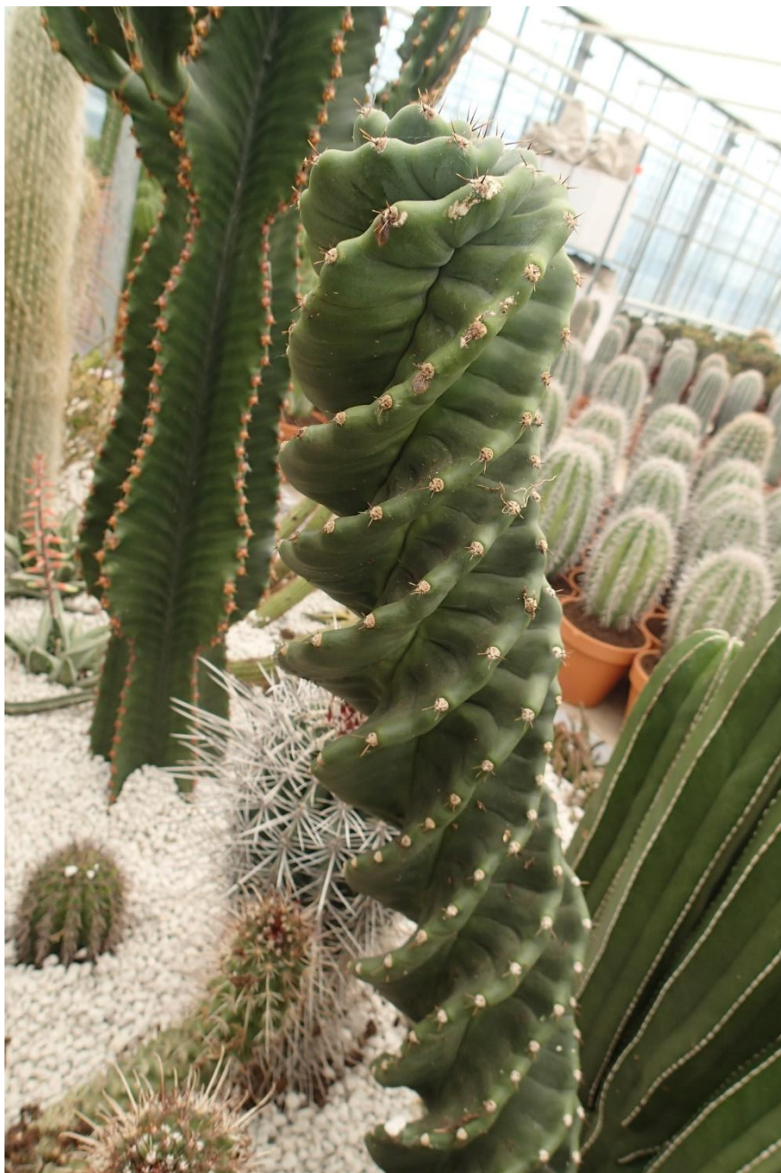
Trichocereus forbesii spiralis in de privéverzameling van Ubink