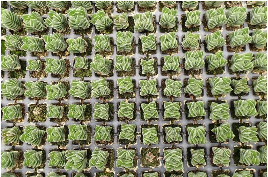
Stekjes van Crassula 'Buddha's Temple'