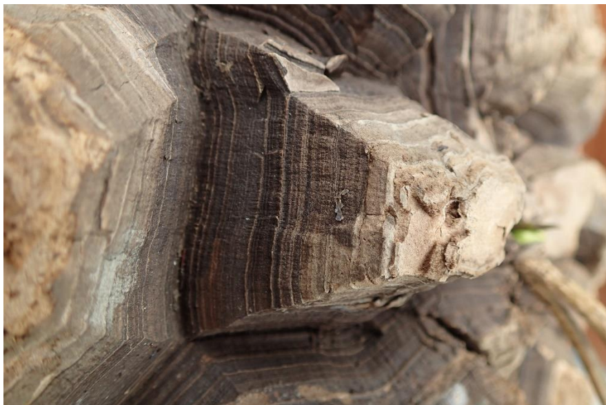
Detail van een olifantspoot