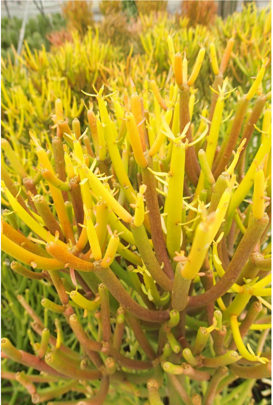
Euphorbia tirucalli stramineus