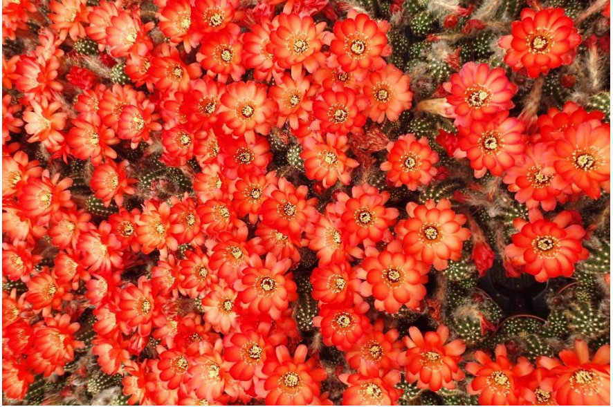
Chamaecereus hybridus in bloom