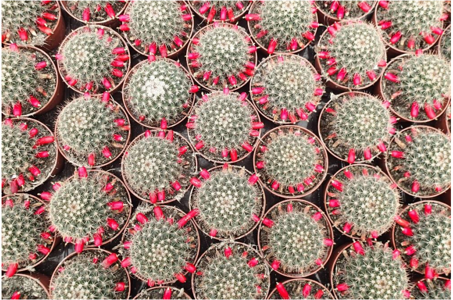
De vruchtjes van deze mammillara zijn misschien wel mooier dan de bloemetjes