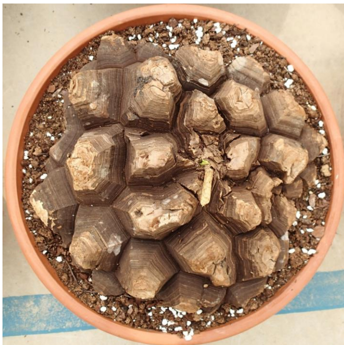
Olifantspoot ( Testudinaria elephantipes ) aan het begin van de groei