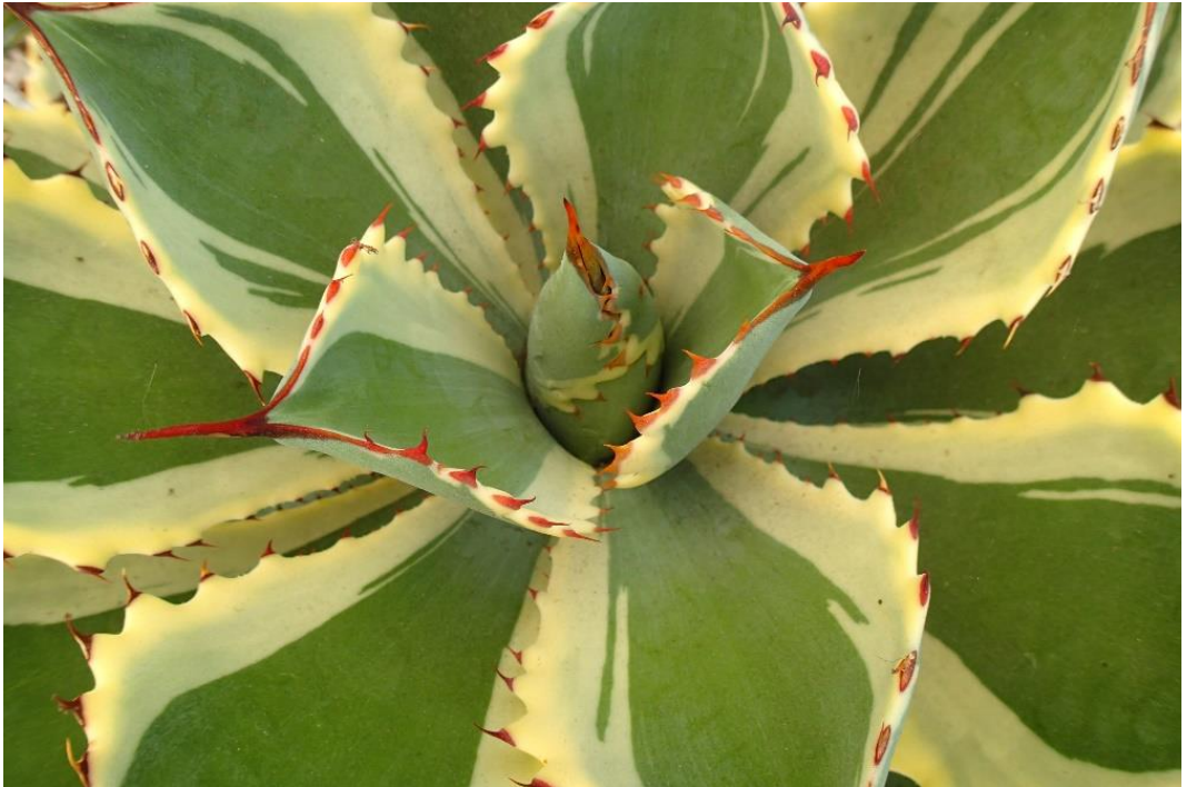
Een fraaie agave, gezien op de open dag bij Ubink (4 juni).

Van en voor de afdelingsleden en alle anderen met een warm hart voor planten in het algemeen en succulenten in het bijzonder.