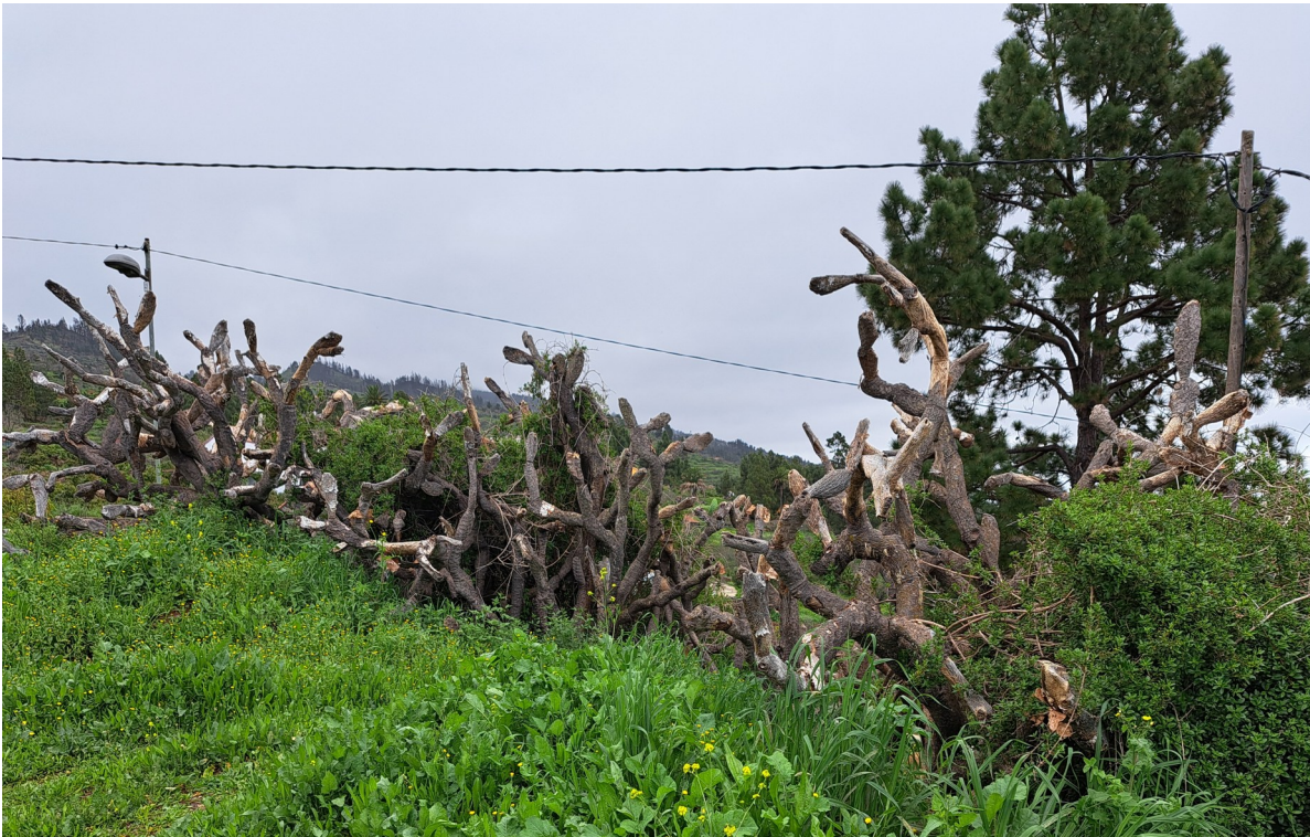
Behandelde (bespoten?) Opuntia ficus-indica die bijna dood zijn, maar toch weer uitlopen bij Puntagorda (dikke knoop)

Dit eiland is het meest westelijke van de Canarische archipel en ook het meest vochtige eiland. Net als Theo constateerden wij dat op de meeste plekken in Tenerife er veel te weinig regen was gevallen. Voor Gomera gold hetzelfde. De verwachtingen voor La Palma waren dan ook hooggespannen. Inderdaad, het was vochtiger dan op de andere eilanden en vooral de noordhellingen van de barranco's waren hier en daar best nat. Sommige plekken waren voor succulentenliefhebbers ronduit fantastisch, andere stukken was er geen vetplant te zien. In vergelijking met andere eilanden had men de Opuntia-plaag goed onder controle.