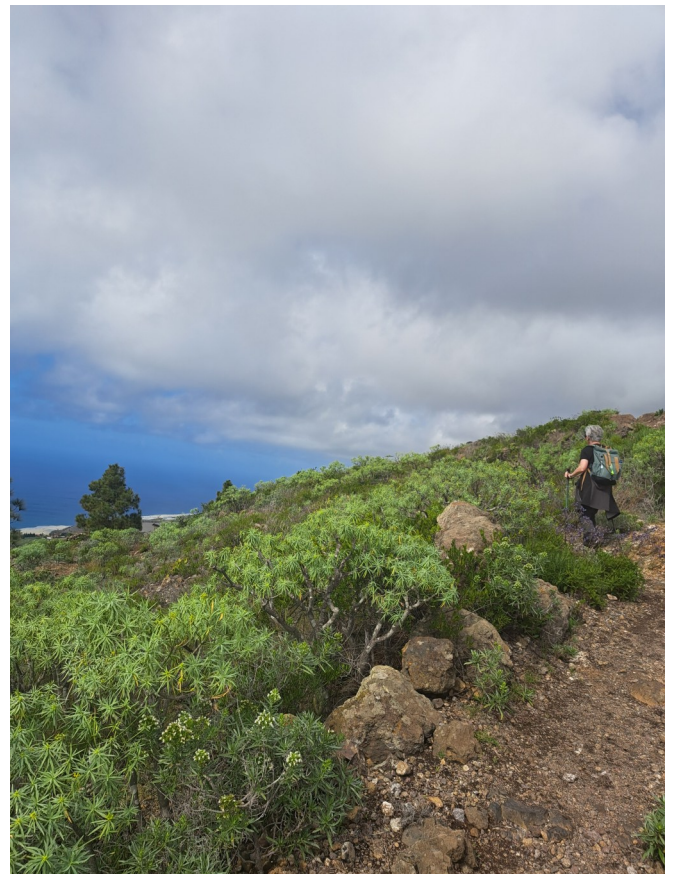
Veel Euphorbia ssp. langs het pad. In de verte de zee