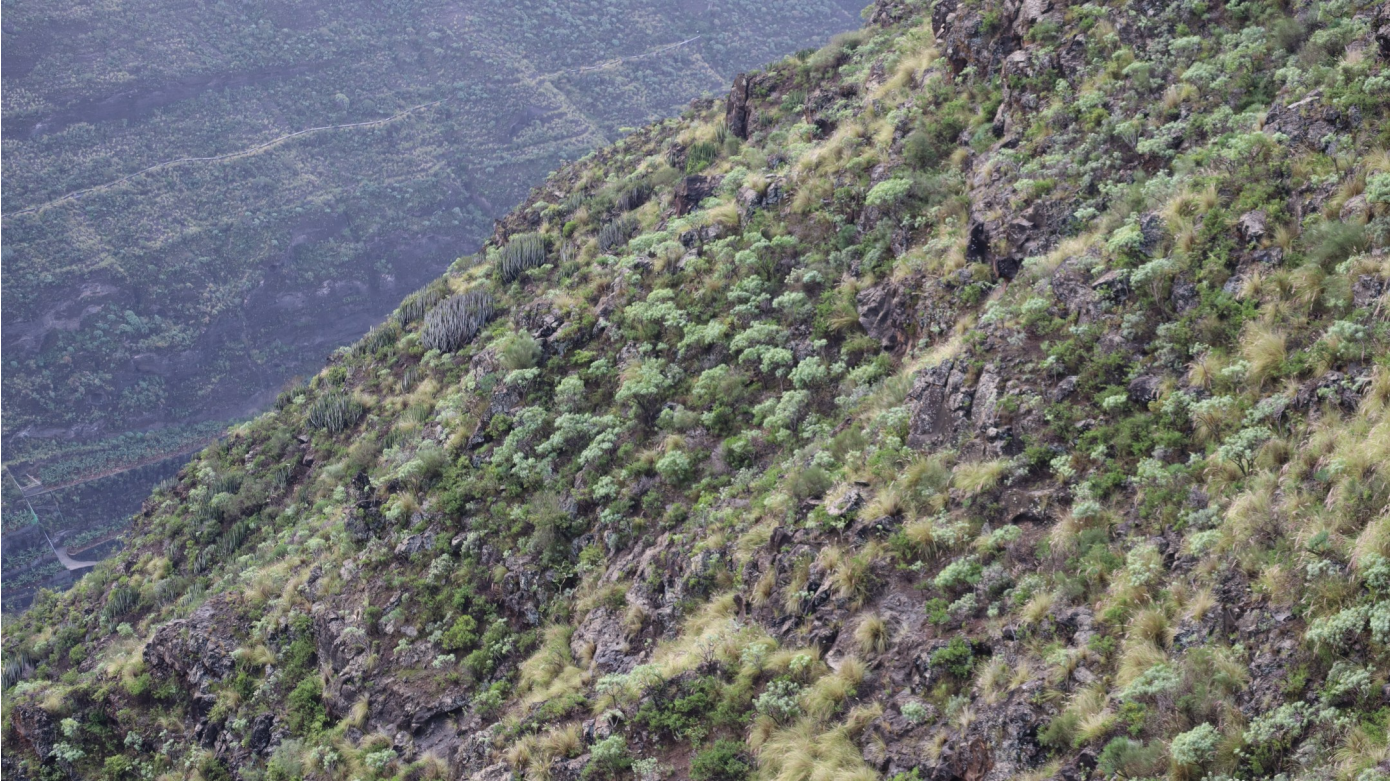
Uitzichtspunt Mirador El Time op de enorme Bco de las Angustias

Van de Aeoniums op La Palma waren we de endemen A. nobile , A. davidbramwellii tegengekomen. A. sedifolium komen ook op andere eilanden voor evenals A. spathulatum . Er bleven nog twee endemische soorten over: A. goochiae en A. canariense ssp. christii . Er was weinig hoop om A. goochiae te vinden, deze soort is zeldzaam en groeit alleen in beschaduwde plekken in het noorden van La Palma. Aeonium aureum en A. arboreum ssp. holochrysum waren nog nooit gescoord op andere eilanden. Tijarifa ten noorden van de Bco de las Angustias leek een kansrijke plek om laatstgenoemde soorten te vinden. Daar lopen een paar kleine kloven naar zee die voldoende vochtig zijn om een weelderige vegetatie te onderhouden.