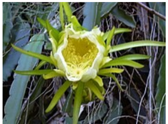
Bloem Hylocereus undatus