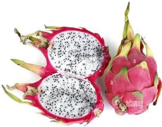
Vrucht Hylocereus triangularis

Hylocereus heeft dunne lange stengels met kleine doorns, grote, geurende bloemen die gedurende één nacht open zijn. De bloemen lijken sterk op de bekende Selenicereus grandiflorus (koningin van de nacht). De twee geslachten hebben zo veel gemeenschappelijke kenmerken dat Korotkova et al in Phytotaxa 327 (1): 1–46. al. (2017) Hylocereus heeft samengevoegd met Selenicereus . Hylocereus is bekend vanwege de vruchten, pitaya of drakenvruchten. Hier afgebeeld de vruchten van Hylocereus undatus , H. triangularis en H. polyrhizus