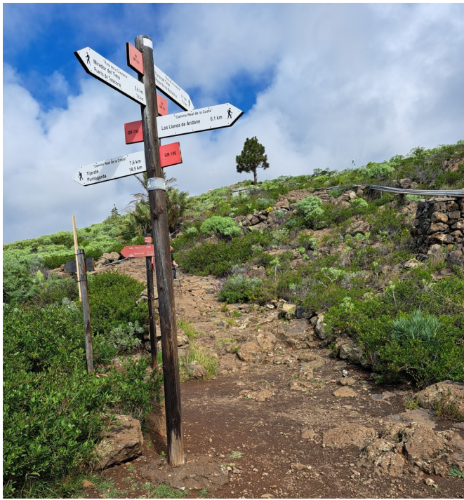
De beruchte wegwijzer waar we fout afsloegen, Bco de las Angustias