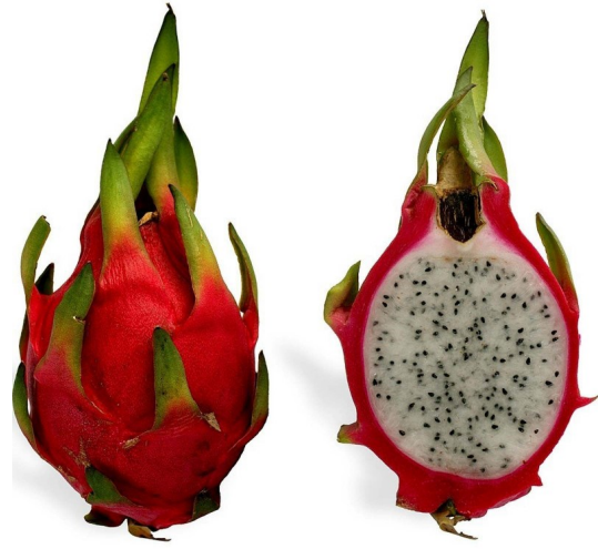
vrucht Hylocereus undatus