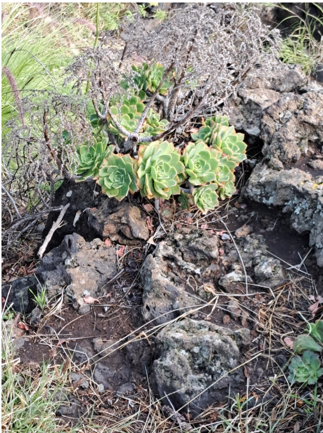
Aeonium davidbramwellii, Barranco de las Angustias, La Palma, 21 januari 2025