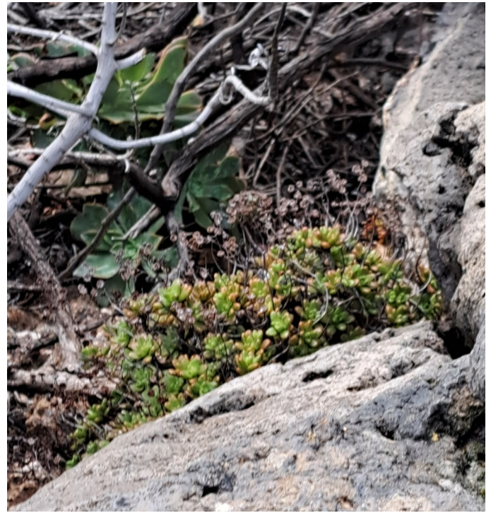
Aeonium sedifolium in de Barranco de las Angustias, 21 januari 2025