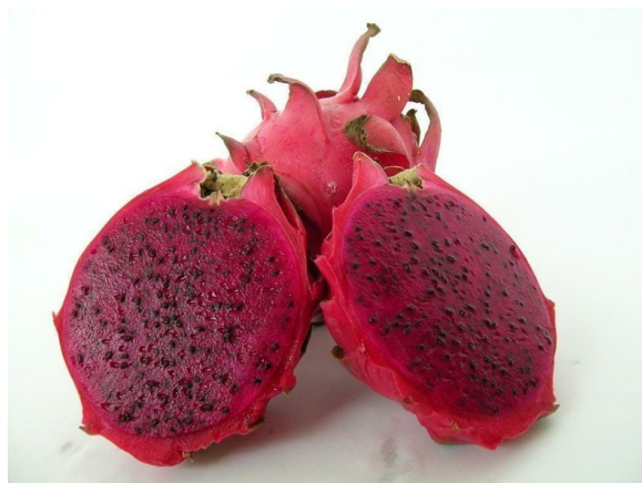
Rode drakenvrucht Hylocereus polyrhizus