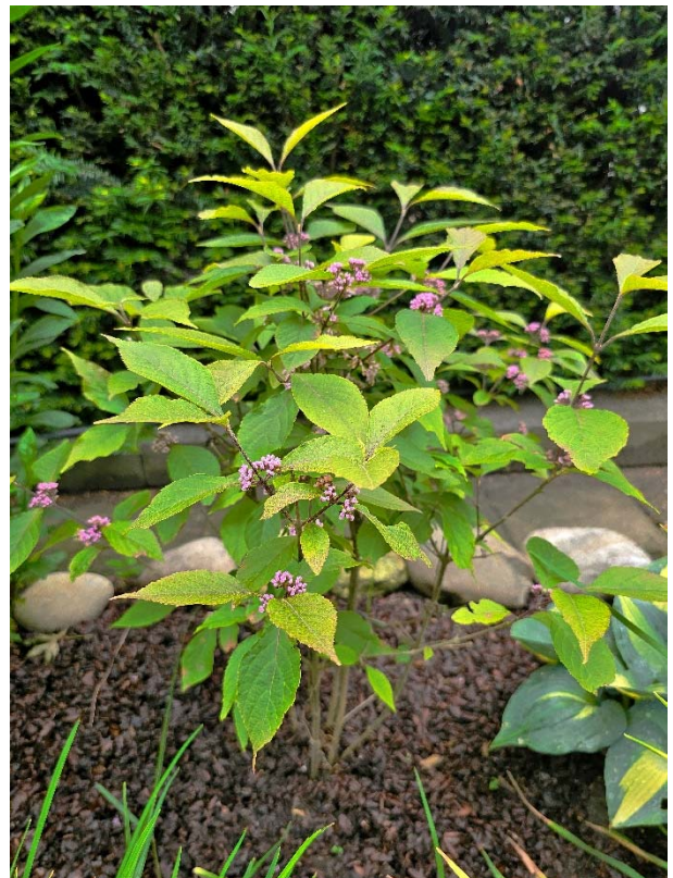
Foto 14: Callicarpa bodinieri giraldii 'Profusion' De bodem is bedekt met cacaodoppen.