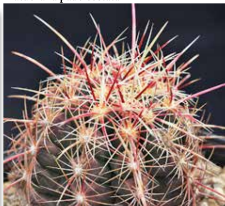
Thelocactus bicolor fa. tricolor