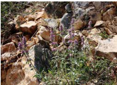
Stachys in het Velebit Gebergte