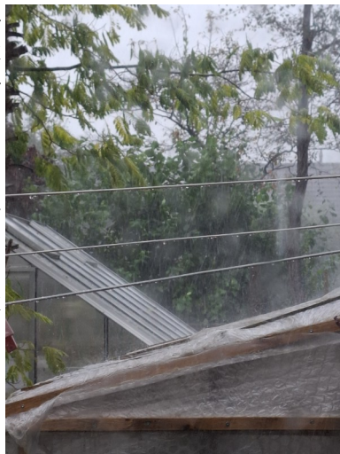
Rechts naast de kas de meidoorn, toen hij er nog stond.

veel meer meneer, en als mensen er last van hebben, dan halen we die bomen weg". "Kan ik jullie een kopje koffie aanbieden, ik bedoel de hele ploeg". Er liep nog 4 man rond, ze hadden een weghelft afge-