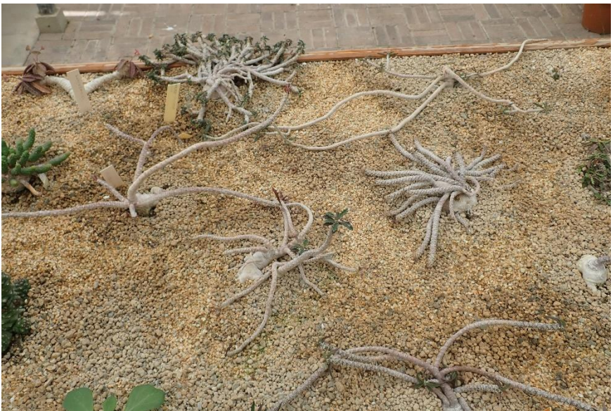
Een tafel met euphorbia's uit Madagaskar.