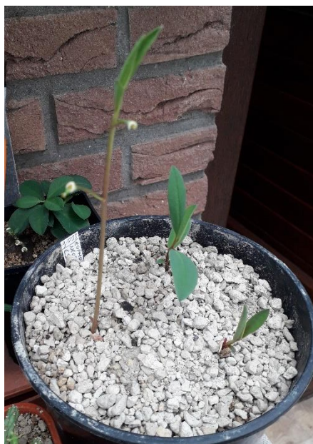
Boven de nieuwe monadenium, onder Euphorbia decidua