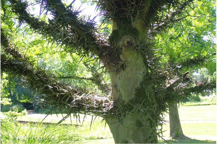
De Japanse valse Christusdoorn, Gleditsia japonica .