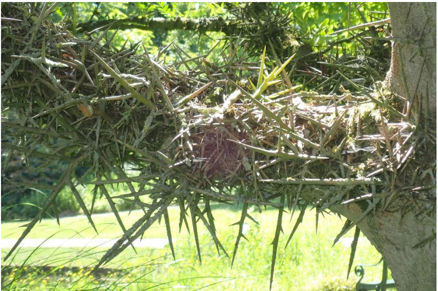
De onderste zijtak van dichterbij.