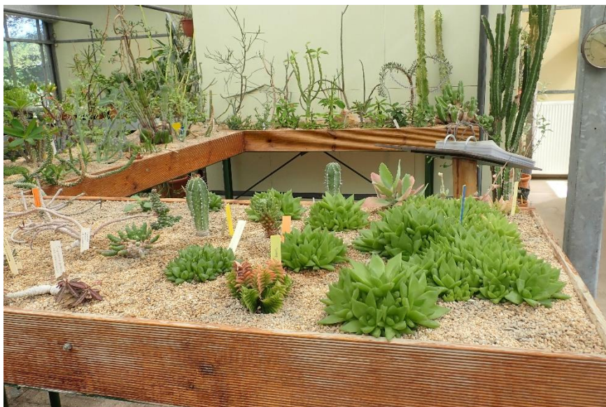
Tafels met haworthia's en euphorbia's.

Even later zag ik dat er toch één cactus stond, zo te zien een Notocactus scopae . Met uitleg over het verschil tussen cactussen en andere succulenten. Overigens waren de meeste planten in deze kas helemaal niet afkomstig uit Madagaskar.