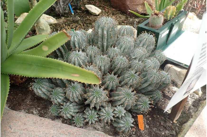
Toch nog één cactus (rechts boven) in de Madagaskarkas. De euphorbia op deze foto komt trouwens niet uit Madagaskar, maar uit Zuid Afrika.