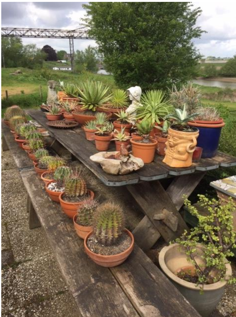
Ze staan weer buiten

Ze hebben meteen water gehad. Het is weer lekker ruim in de kas.