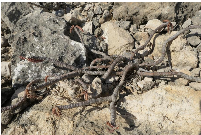
E suzannae marnierae