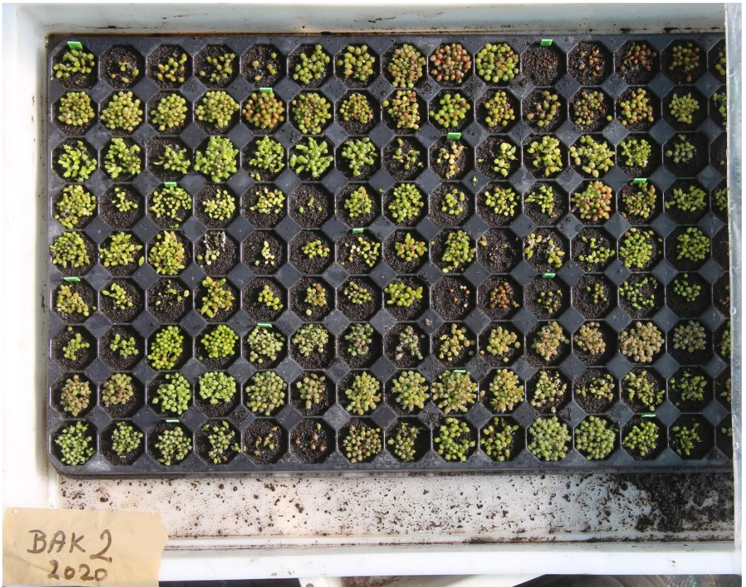
Zaaisels van Ludwig in fororolletjesbusjes