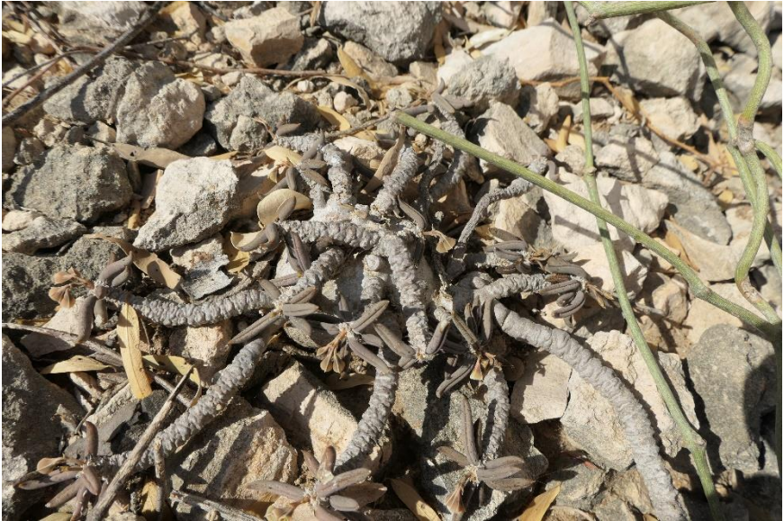
E. cylindrifolia ssp. tuberifera