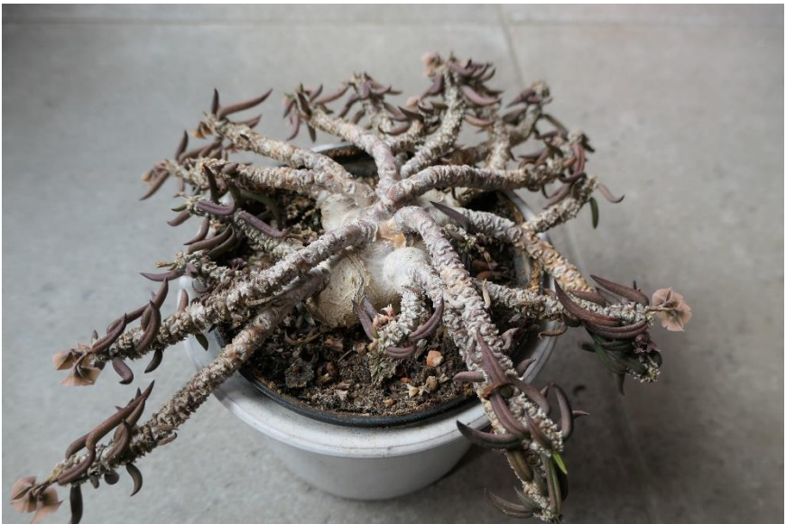
Mijn eigen E. cylindrifolia ssp. tuberifera op de vensterbank in de huiskamer.