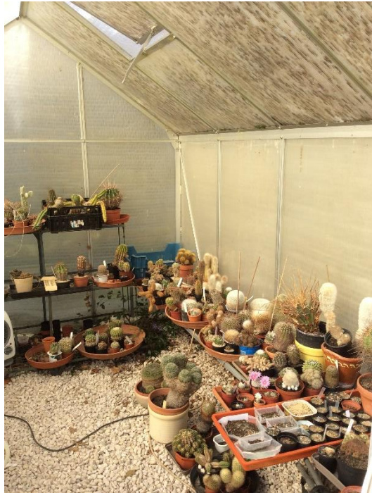
Een kijkje in de kas.

Net daarvoor had ik een klein kasje gekocht van 1.85x2.50 en dat kasje staat er nog steeds. De zijkanten en bovenkant zijn bedekt met plastic platen, vermoedelijk polycarbonaat, dubbelwandig, met een soort gangetjes ertussen. Ze zijn behoorlijk bruin