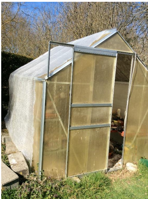
Het kasje in de winter.

Naderhand verhuisden we en het kasje ging mee, maar het bleef staan toen we in 2002 naar Frankrijk verhuisden. Bij de verhuizing is de ellende al begonnen: naamkaartjes, (waar ik al niet zo sterk in was) waren verdwenen en de eerste tijd stonden de plantjes in een grote plastic tunnelkas, die aan de overkant van ons weggetje