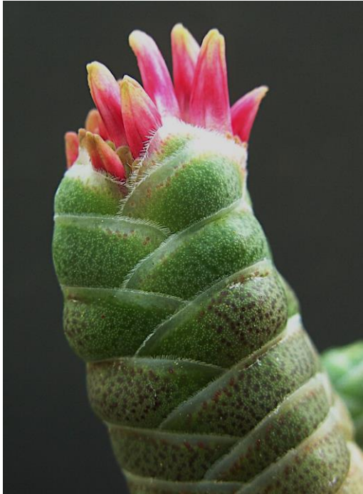
Crassula barklyi in knop