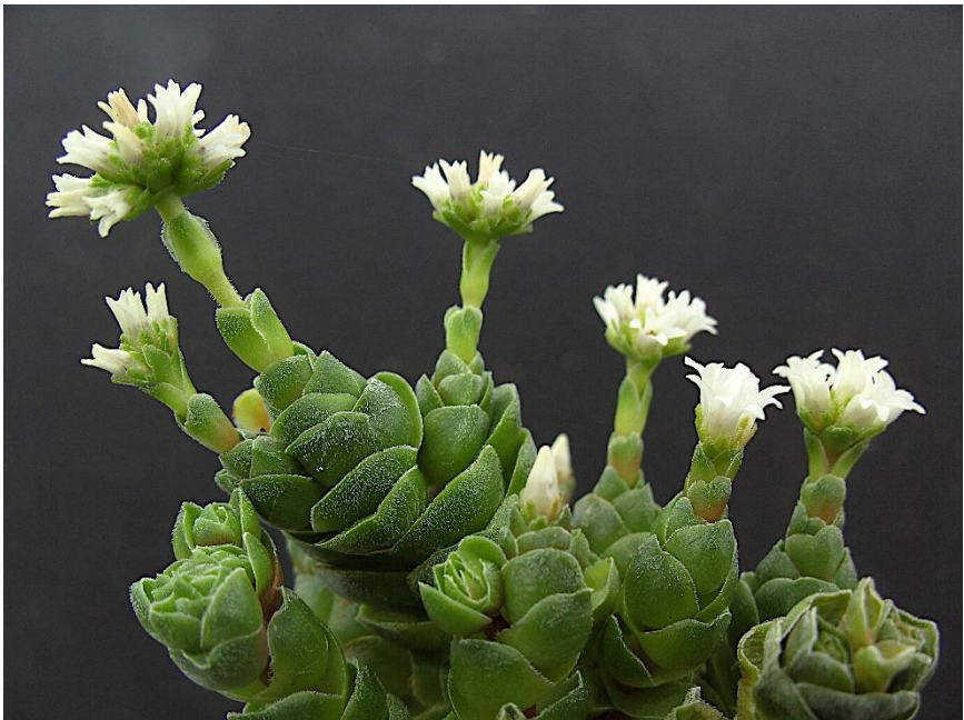
Crassula 'Emerald'. De totale breedte van dit plantje is ongeveer 5 cm

Het leuke is zoals bij veel crassula's dat deze in de winter bloeit. Op de foto hieronder zie je hoe het plantje er vandaag 3 maart 2019 uitziet.