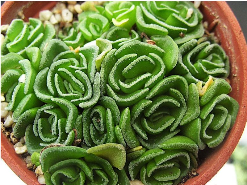
Crassula susannae in een 5,5 cm potje.