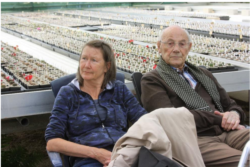
Even uitblazen en dan weer naar huis