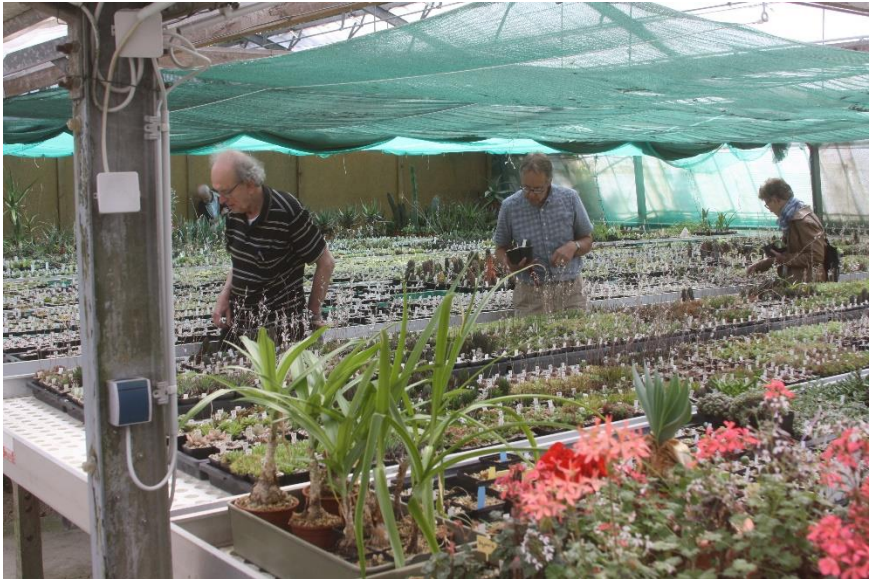
Speuren in de immense kas van Eden Plants