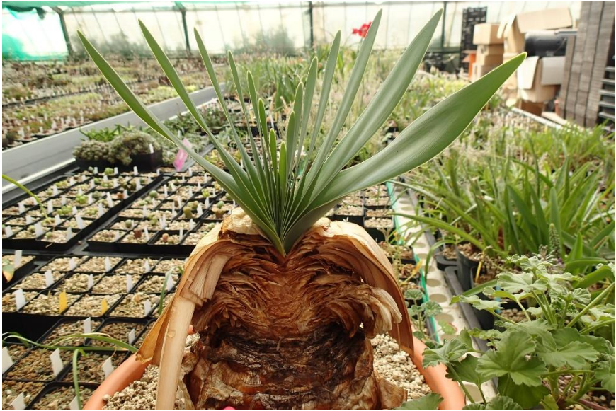
Boophane disticha bij Eden Plants