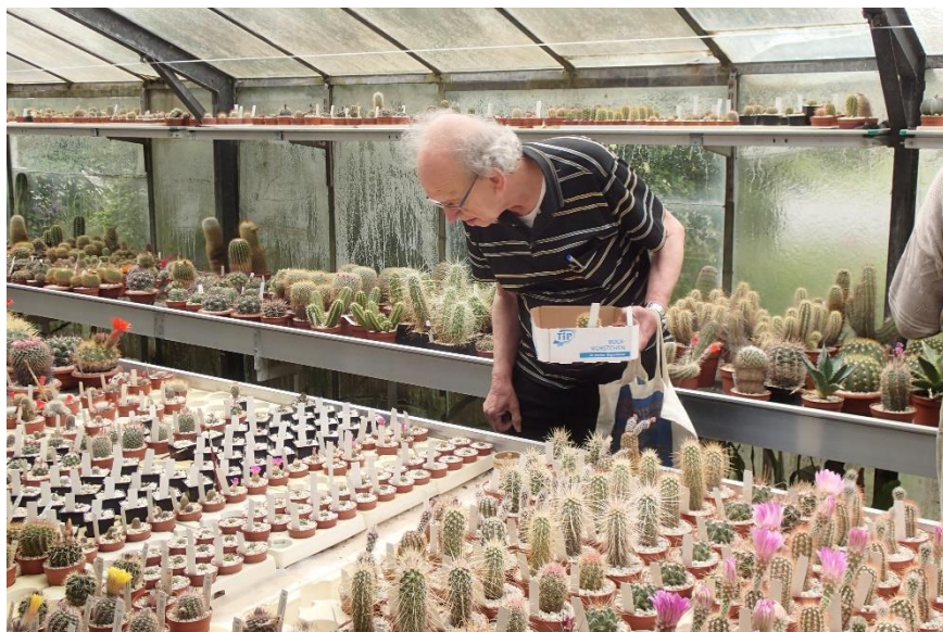
Gerard op cactusjacht