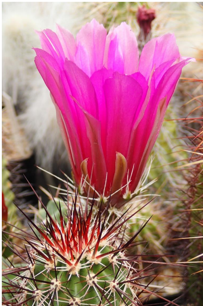
Een bloeiende echinocereus in de kas van Piltz