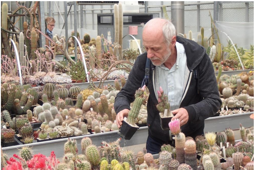
Welke is mooier?