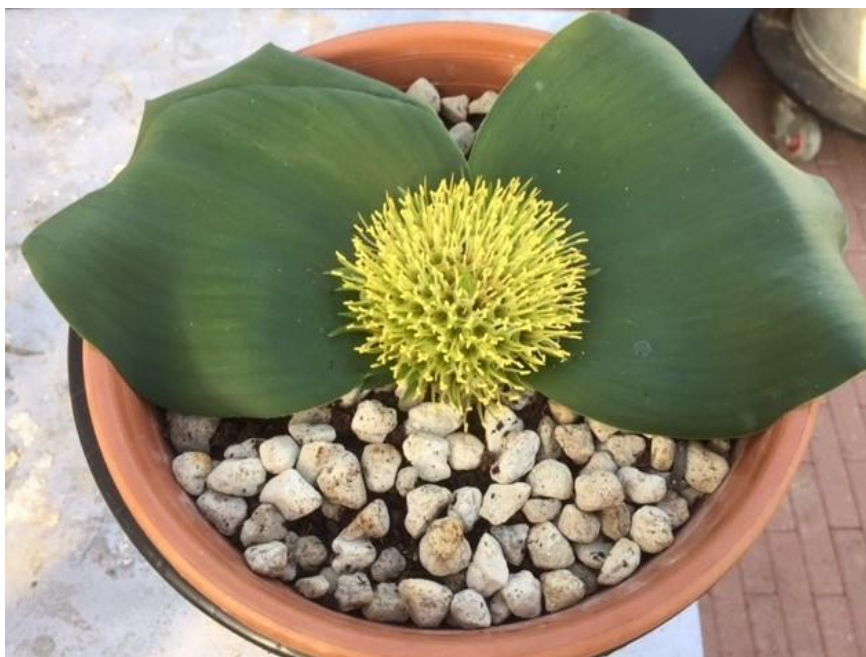
De Massonia depressa in volle bloei op 8 januari 2018

Leuk he ,ik ben er blij mee. Tijs als nog bedankt. En op 9 januari werd ook de naam genoemd: Massonia depressa .