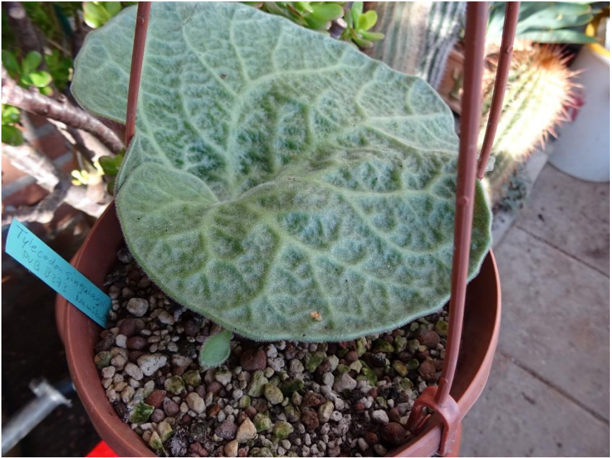
Eind november: met allereerst begin van de bloemstengel