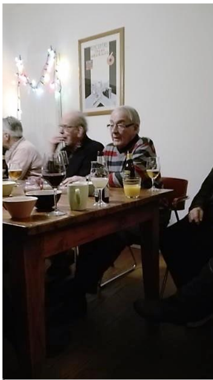
Het was weer gezellig