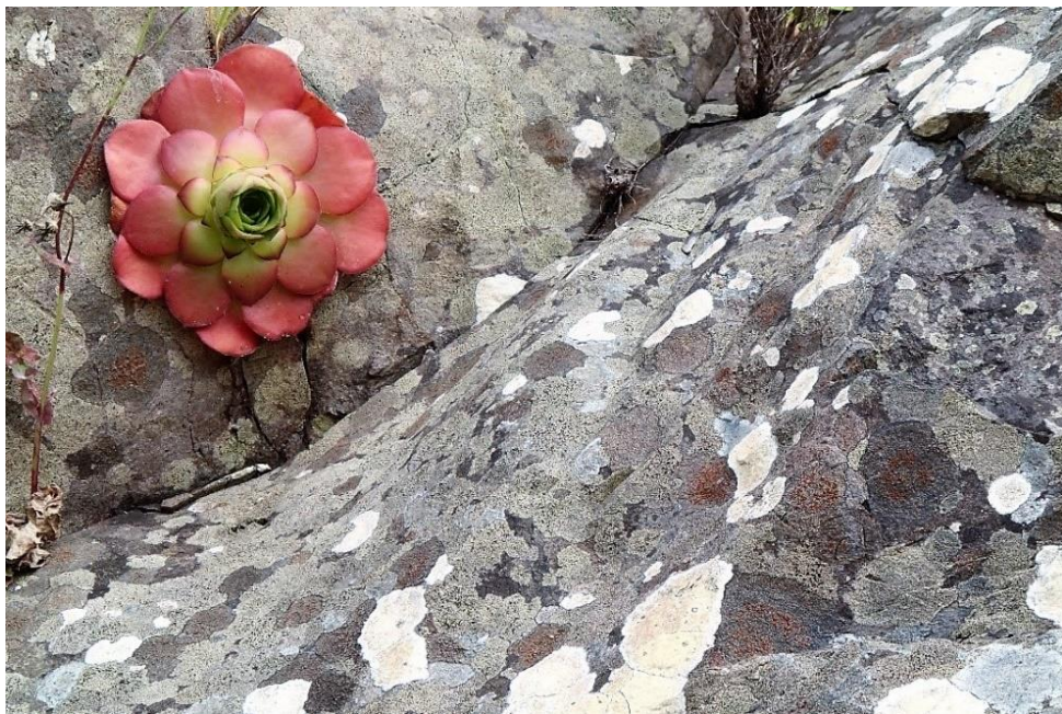
Aeonium glandulosum, een endemische soort op Madeira

Op dinsdag 6 maart zal Theo vertellen over de plantengroei op Madeira. Dit eiland wordt vaak 'Het bloemeneiland' genoemd maar wel aangeduid als een 'drijvende tuin' en als 'botanische smeltkroes'. Dus dat belooft wat.