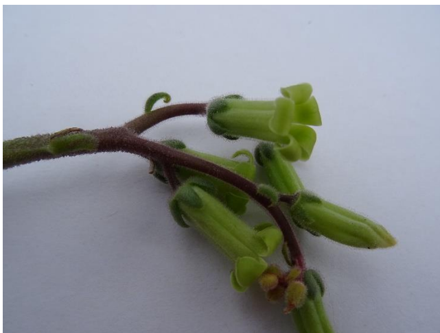
Detailopname van de bloemen