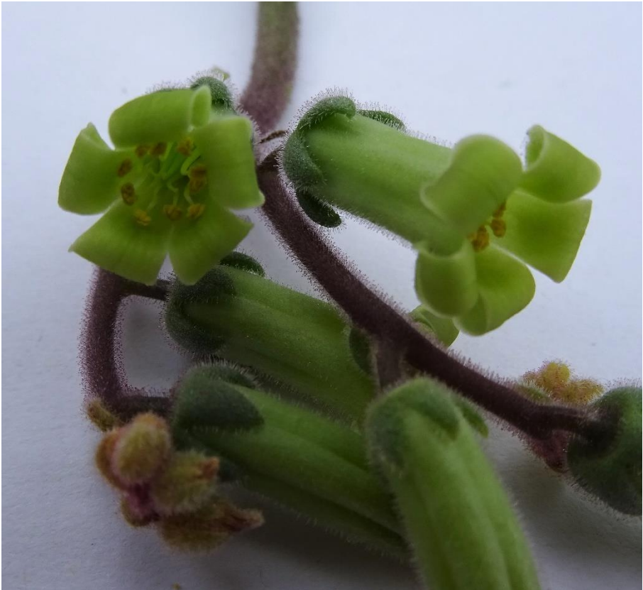
De bloemen van Tylecodon singularis (foto Riet)