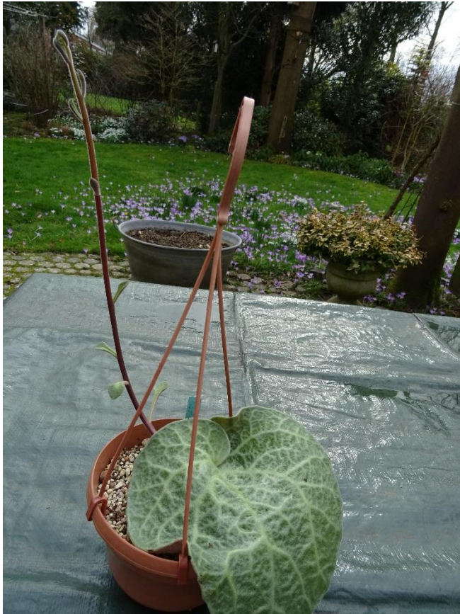
In maart met doorgegroeiide bloemstengel