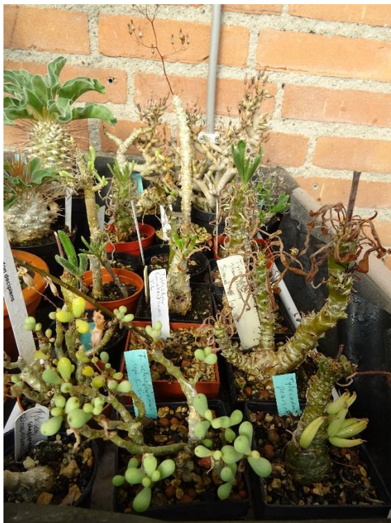
Mijn verzameling Tylecodons aan het begin van de groeitijd (september)

In het november nummer van Noviocactum 2016 schreef ik al eens een stukje over mijn fascinatie voor het geslacht Tylecodon. Ooit begonnen met een gekregen plantje bij een uitstapje van de afdeling heb ik inmiddels een kleine verzameling opgebouwd. (zie foto hiernaast)