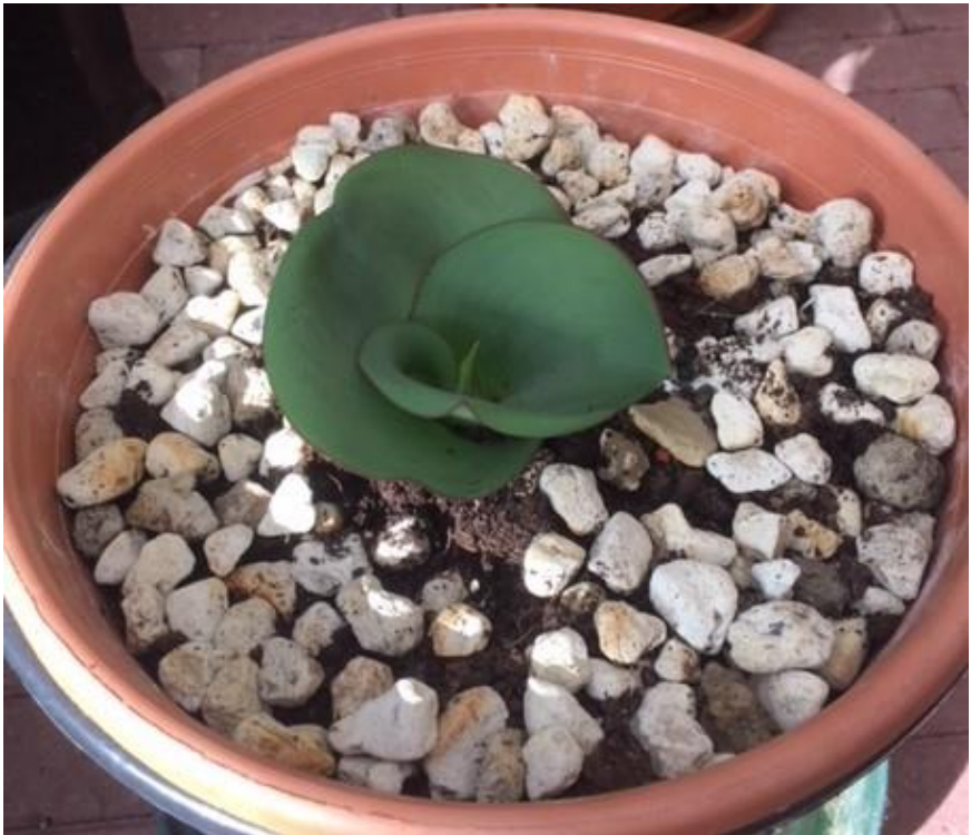
De Massonia depressa op 2 oktober 2017

Nou weet ik niet meer of de plant nou verloot werd of dat ik mij gewoon over de plant wilde ontfermen. De plant ging in ieder