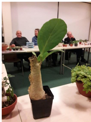
Cyphostemma juttae , ook van Mireille.