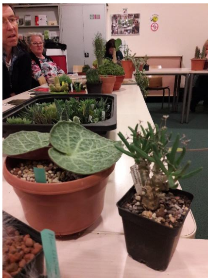
De tyledodons van Riet.