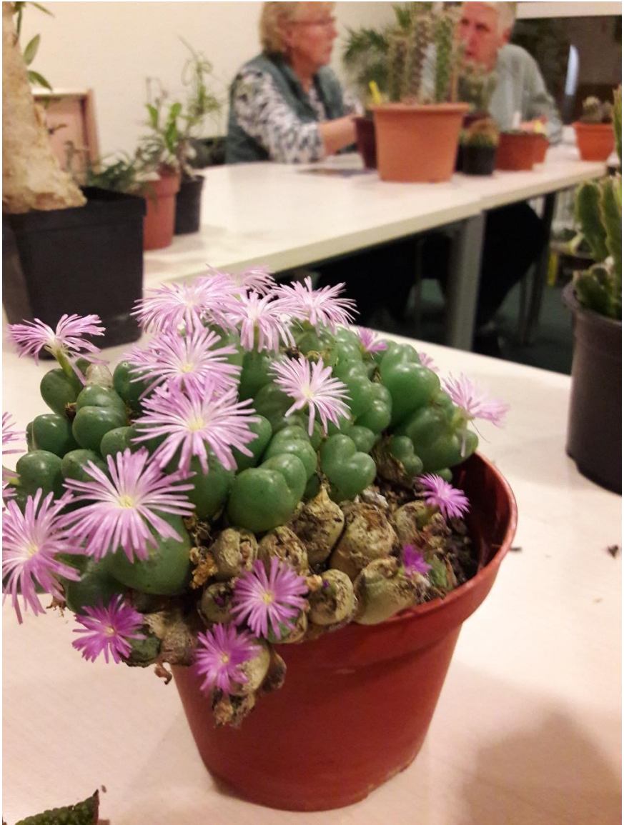
Een prachtig bloeiende conophytum, ook van Lieda