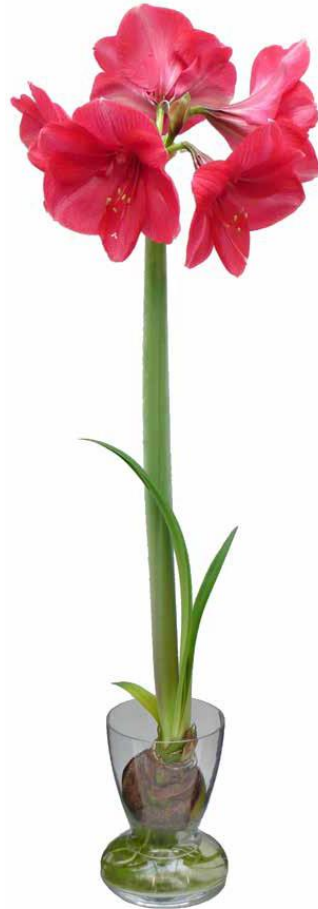
Nog een foto uit het boek 'The Curious History of the Bulb Vase'.

Terug naar het moment waarop ik mijn glaswerk weer terug moest zetten. Ik besloot toen om een deel van mijn bollenglazen echt te gaan gebruiken. Voor het keukenraam bij het aanrecht zette ik een groot aantal bollenvazen neer en vulde ze met bollen. Amaryllissen-, hyacinten- en tulpenbollen vonden zo een plaats. Elke dag kijk ik nu of er wat gebeurt. Komt er al een puntje uit de bol?