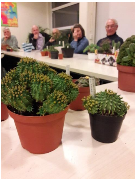
Een mannetje en vrouwtje van de Euphorbia suzannae van Theo.