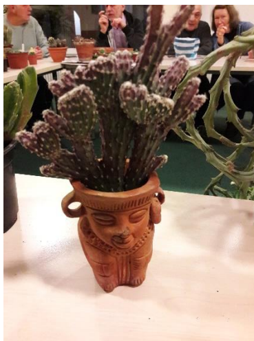
Riet De monvillea spegazzinii in het ludieke potje, meegebracht door Lieda.

En na de pauze loopt iedereen rond om planten te bekijken te benoemen en of anderszins commentaar te leveren. Riet verloot haar Fockea edulis . Antoon mag hem mee naar huis nemen en 7 euro gaat in de kas.