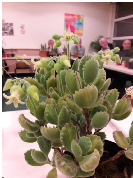
Ook van Theo een mooi bloeiende Cotyledon tomentosa subsp. ladysmithiensis .