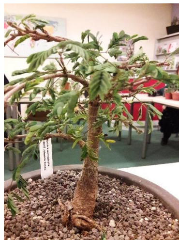
De bonsai van Ton, maar of Bursera mirrophylla de juiste naam is?