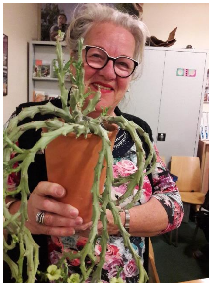
Lieda trots op de mooie monadenium.