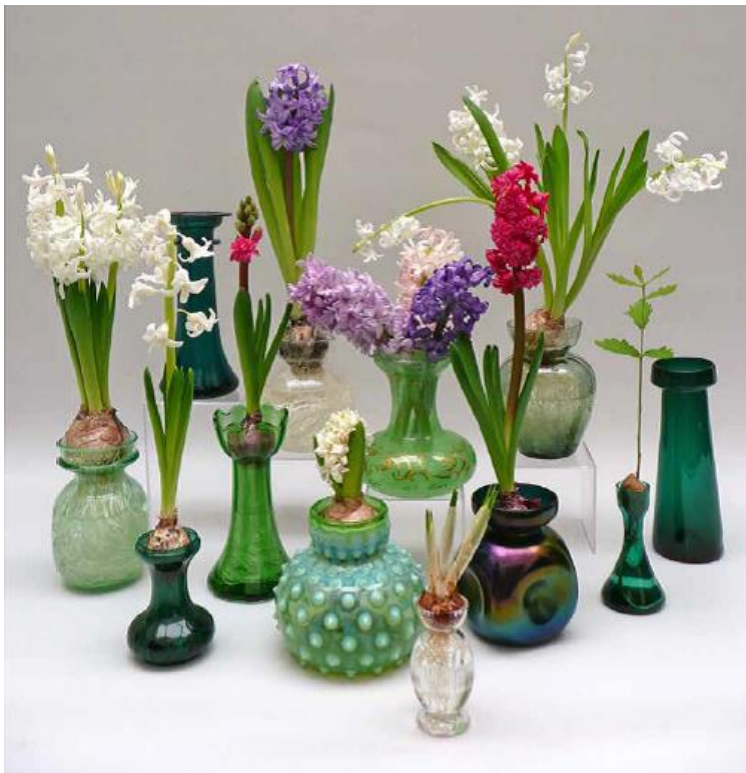
Foto uit het boek 'The Curious History of the Bulb Vase'.

Toen kwam er een kink in kabel. De objecten zouden niet verzekerd zijn en dat was voor mij een toch te groot risico. Je weet maar nooit wat er gebeuren kan.