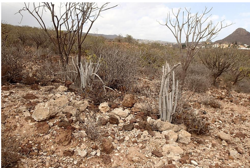
Krijt witte Ceropegia fusca 'in het wild'.

*) pilates is een actieve vorm van Yoga.