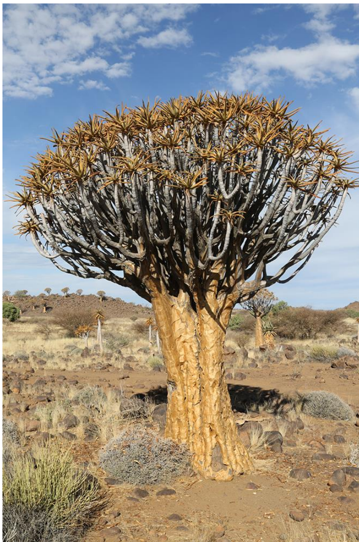
De kokerboon: Aloe dichotoma