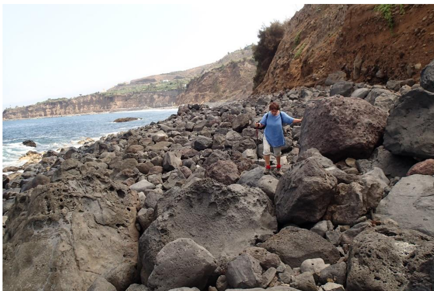
2 km klauteren over rotsblokken