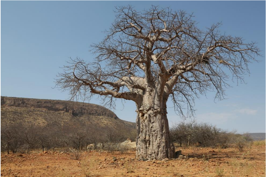
Boabab: Adansonia digitata