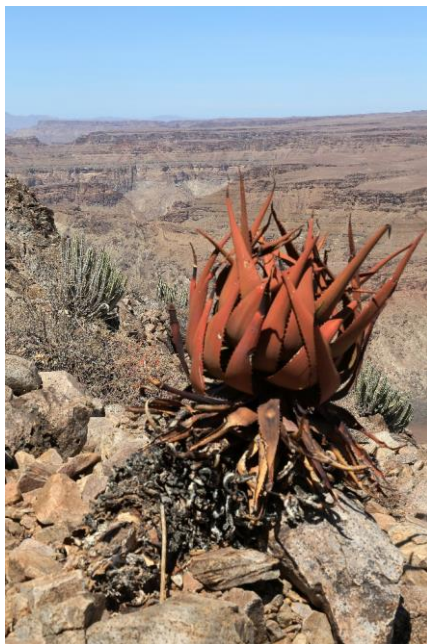
Aloe garipensis voor de Fish River Canyon