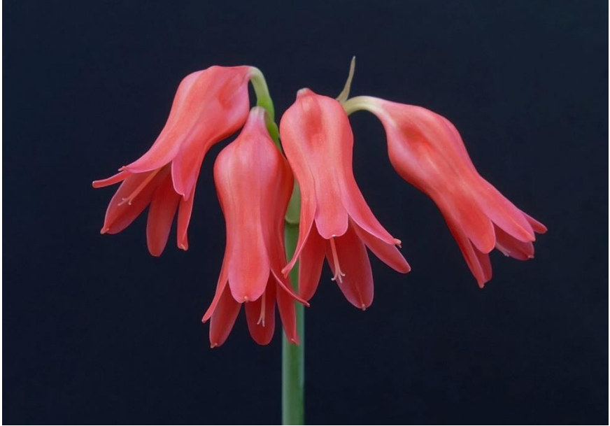
Cyrtanthus staadensis

- Tulbaghia: wordt 'wilde knoflook' of 'Kaapse knoflook' genoemd for obvious reasons, en is inderdaad vrij nauw verwant aan Allium sativa .