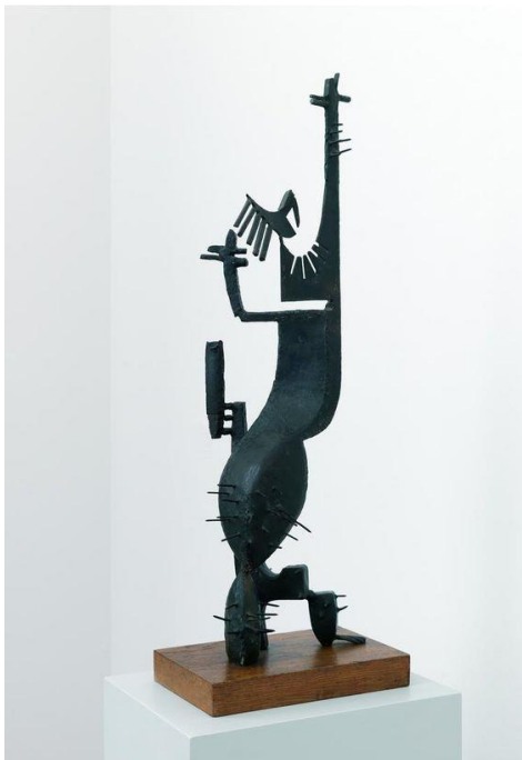
“Homme Cactus II”, ook wel “Madame Cactus” genoemd.

Gonzalez heeft dus meerdere exemplaren gemaakt van dit metaalwerk. Centre Pompidou in Parijs heeft er ook een. In 1999 is er een geveild door Christie's. Opbrengst $ 478.000. In 2016 werd er opnieuw een geveild door Christie's (misschien dezelfde?). Opbrengst $ 2.345.000. En als je je afvraagt of er ook een “Homme Cactus II” bestaat, inderdaad. Wonderlijk genoeg staat dat werk ook bekend onder de naam “Madame Cactus”.