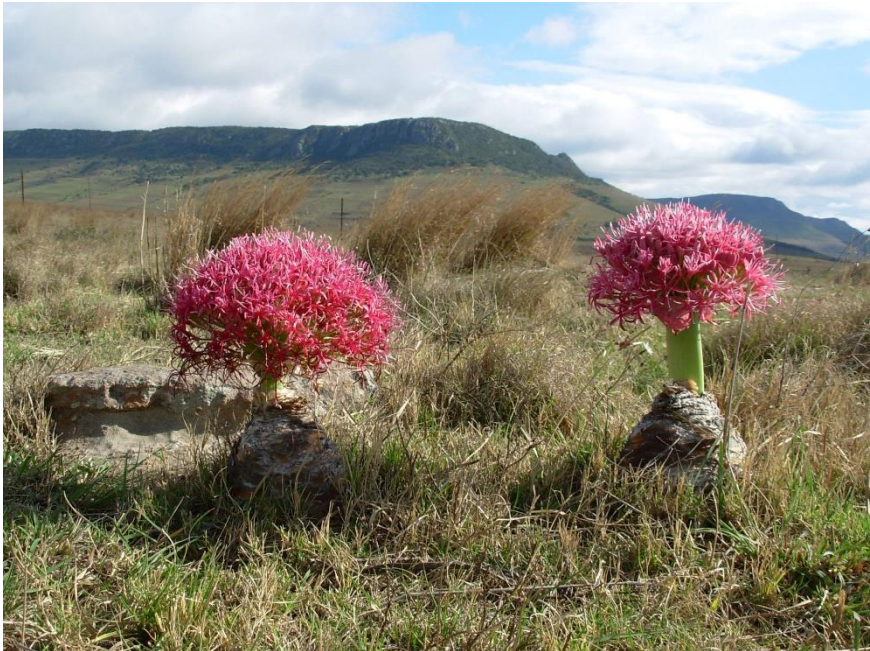
Boophone disticha, Cathcart District

Van en voor de afdelingsleden en alle anderen met een warm hart voor planten in het algemeen en succulenten in het bijzonder.