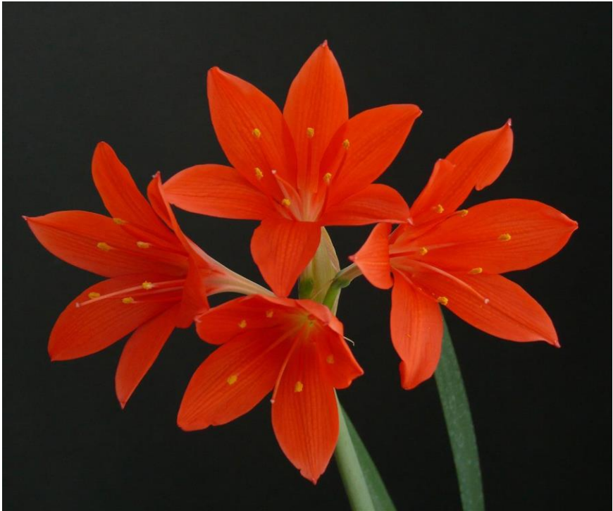
Cyrtanthus elatus

soorten helemaal opdrogen. In de natuur staan ze vaak in zandgrond. Huizing heeft veel foto's uit de Oostkaap, één van de rijkste gebieden wat betreft bollen en knollen. Het is een zomerregengebied en er is bijna elke dag neerslag.