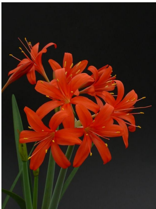
Cyrtanthus elatus x montanus Zie het verslag van de bijeenkomst van 4april

Op 6 juni staat 'kasbezoek' bij Gerard en Truus Hendrickx op het programma. Nadere gegevens volgen in het volgende nummer van Noviocactum.