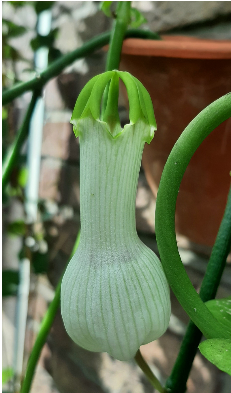
Ceropegia ampliata collectie Ben 2021