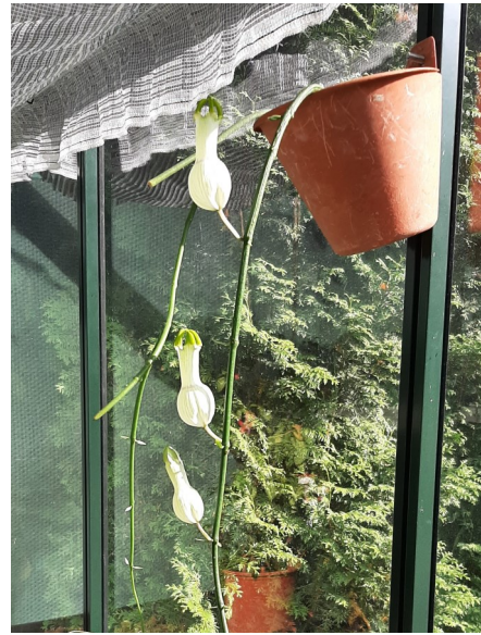
Ceropegia ampliata Collectie Ben 202