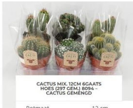
CACTUS MIX. 12CM 6GAATS HOES (297 GEA) 8094 - CACTUS GEMENGD