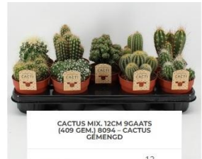
CACTUS MIX. 12CM 9GAATS (409 GEA) 8094 - CACTUS GEMENGD