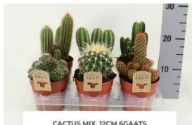
CACTUS MIX. 12CM 6GAATS (CACTUSMIX12CM) 8094 - CACTUS GEMENGD

Dit is een enorme succulenten en cactuskwekerij van het type Bol.com leverancier. Ze zijn gevestigd op Lelieweg 4, in Bleiswijk. Ze hebben kassen ter grootte van enkele hectares. Wij kregen de VIP - behandeling terwijl we helemaal niet tot hun klantendoelgroep behoren.