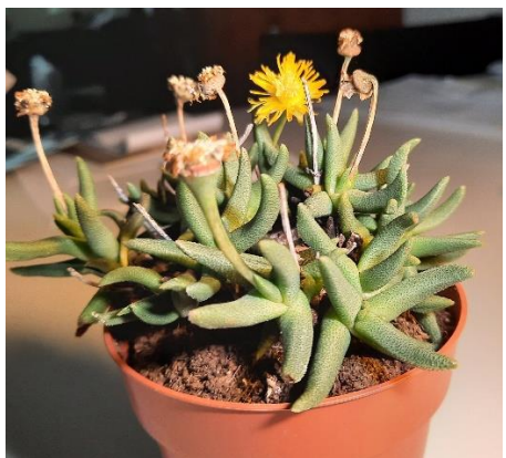
Bergeranthus multiceps (Aizoaceae, ijskruidfamilie)

Vanwege de lage prijs en de hoge kwaliteit is dit adres zeer aanbevelenswaardig.