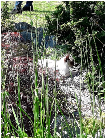
Siamese kat verborgen in het groen