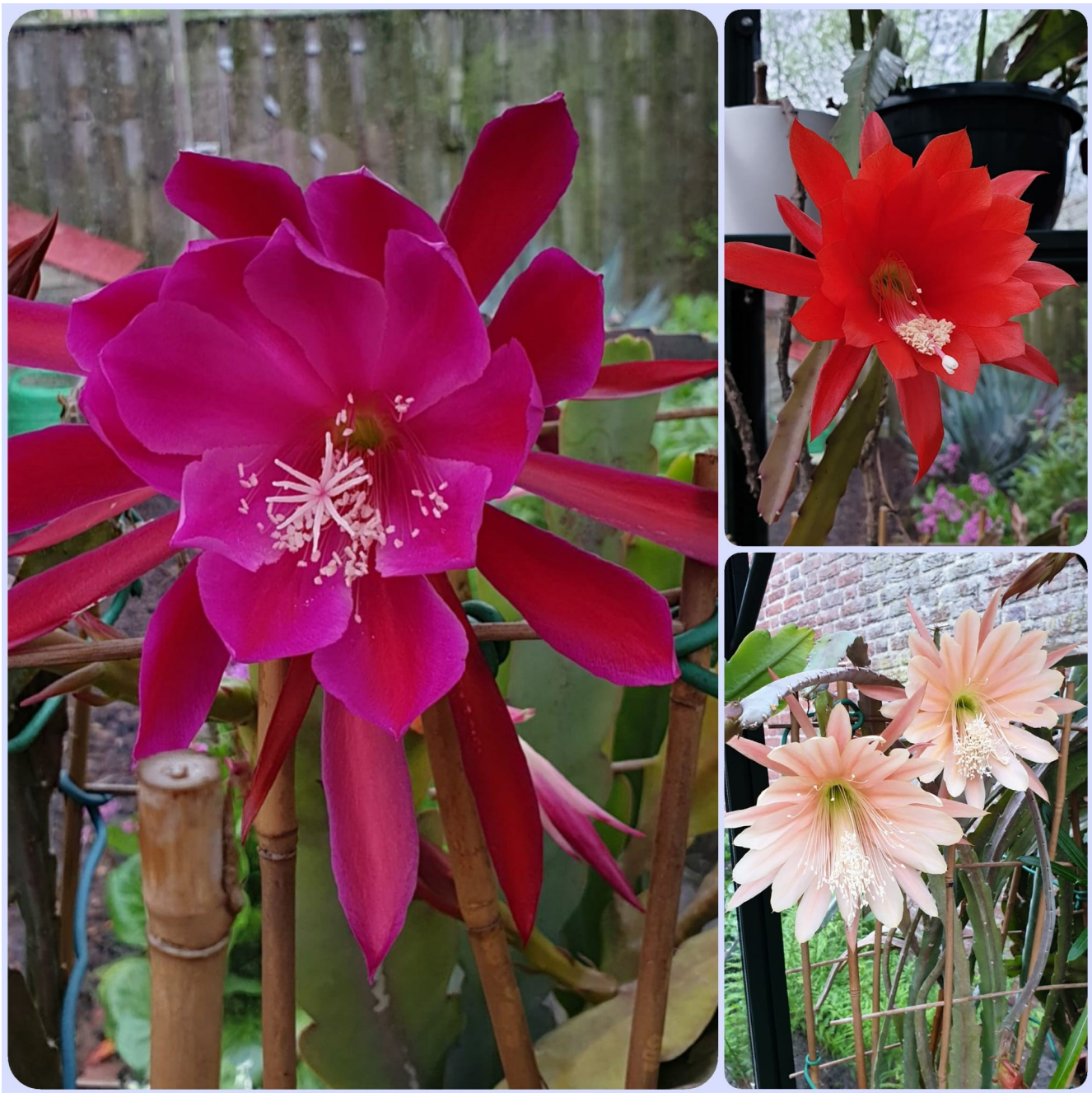
Collage van bloeiende Epiphyllum planten bij Threes thuis, een dag na "Planten op tafel"