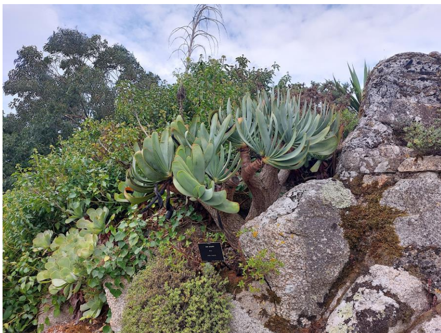
Aloe (Kumara) plicatilis

Loes en ik zijn in september 2022, na het jaarlijkse bezoek aan de ELK in Blankenberge (België) voor een korte vakantie naar Bretagne geweest. En een bezoek aan deze botanische tuin was natuurlijk onvermijdelijk. We hebben er ongeveer 2,5 uur doorgebracht. Bij de ingang word je ook in het Nederlands verwelkomd (afbeelding vorige pagina). Meteen na het passeren van het loket loop je naar perken met agaven, aloë's, yucca's en ook echiums (van de Canarische eilanden en Madeira). Dan valt het oog ook op de doorloopkas van plasticfolie, die in 2014 geplaatst is om de niet winterharde succulenten en bolgewassen in onder te brengen. OP meerdere plekken in de tuin kan je plaatsnemen op een van de strategisch geplaatste bankjes. Op een gegeven moment kan je een trap beklimmen (afb voorpagina) die je naar de top van een 18 meter hoge klif brengt. Vandaar heb je een prachtig uitzicht op de haven en de zee. Langs de trap staan ook veel mooie planten zoals een oude Aloë (Kumara) plicatilis , afbeelding hieronder.