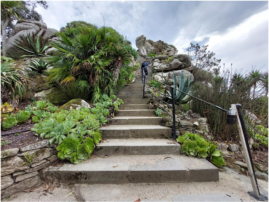
Aeoniums en meer in de exotische tuin van Roscoff (Bretagne)