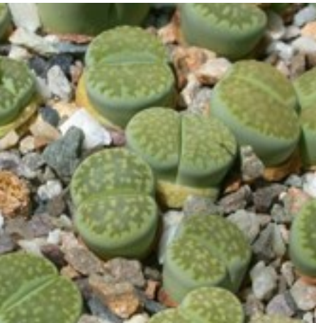
Lithops (levende steentjes)

volop te bloeien! Eigenlijk was ik al eerder onder de indruk van die wonderbaarlijke planten; ik herinner me dat mijn oudere broer een exemplaar van school had meegekregen, een Echinopsis als ik me goed herinner. Nabij Breukelen (Nieuwersluis) had ik een volkstuintje en daar kwam een kasje te staan, gemaakt van eenruiters. Dat dat ding het heeft gehouden mag een wonder wezen want het waren al oude eenruiters. Ik kweekte daar naast cactussen ook groenten in.