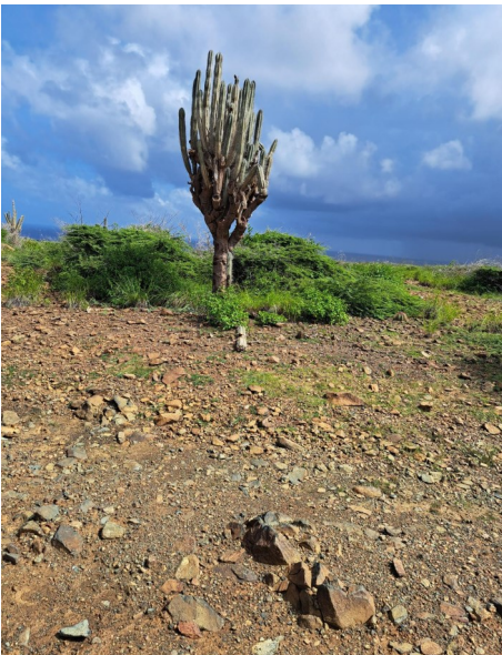
Stenocereus repandus op Aruba

hart dat deze verzameling uit bezuinigingsredenen weg moest uit Wageningen. Mij ging aan het hart hoe de verzameling er na een aantal jaren door verwaar-