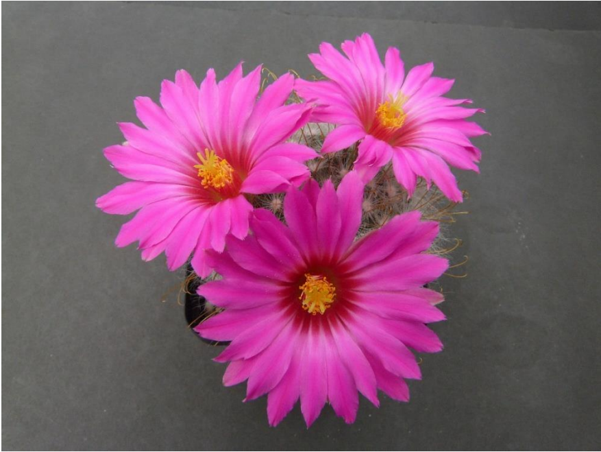
5 Mammillaria guelzowiana Werd. 1928 - inzender Wil van Vroenhoven.

Een prachtig bloeiende Mammillaria met grote, hier plantbedekkende bloemen. Een gangbare naam voor deze soort is ook Mamm. guelzowiana var. robustior