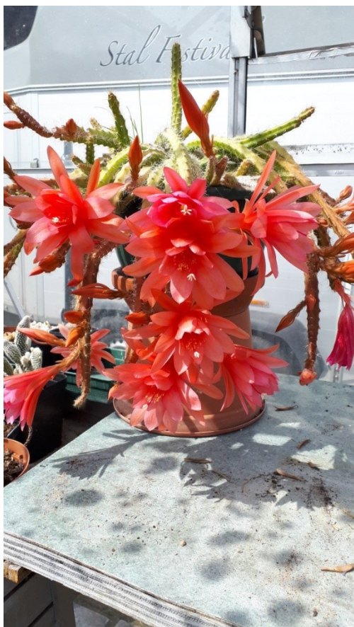
Plant uit de kas van Lies Oudshoorn