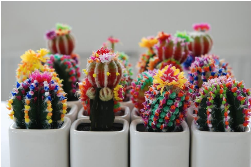
Namaakcactusjes van de Action met siliconen versieringen.