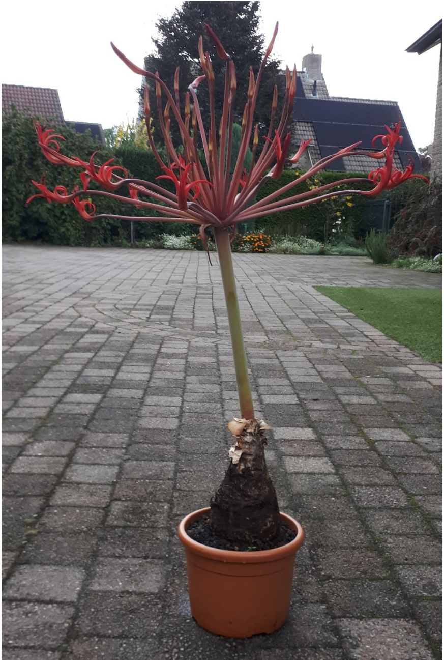
In bloei op 19 september