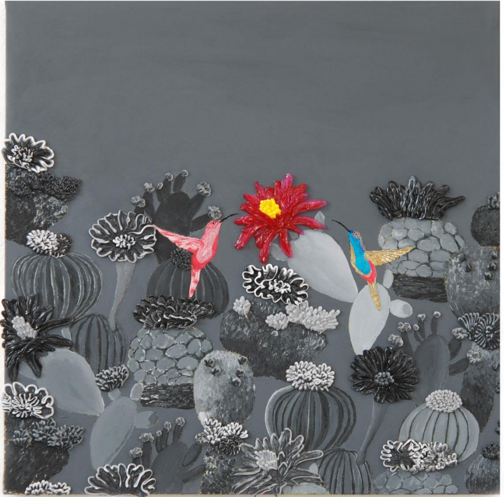
Zonder titel (70 x 70 cm)