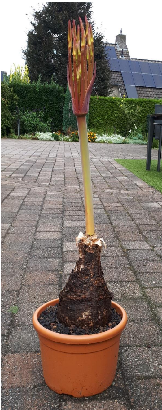
In de knop op 9 september