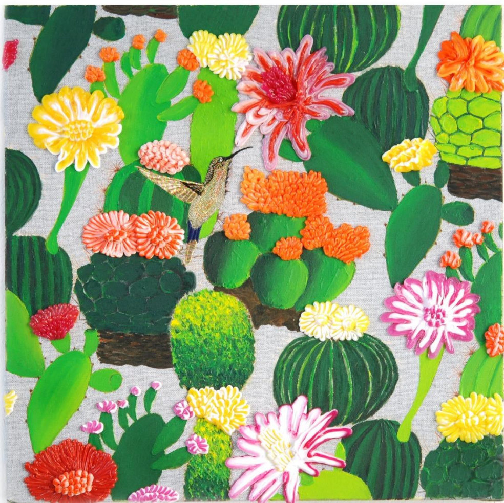
Eden (50 x 50 cm)