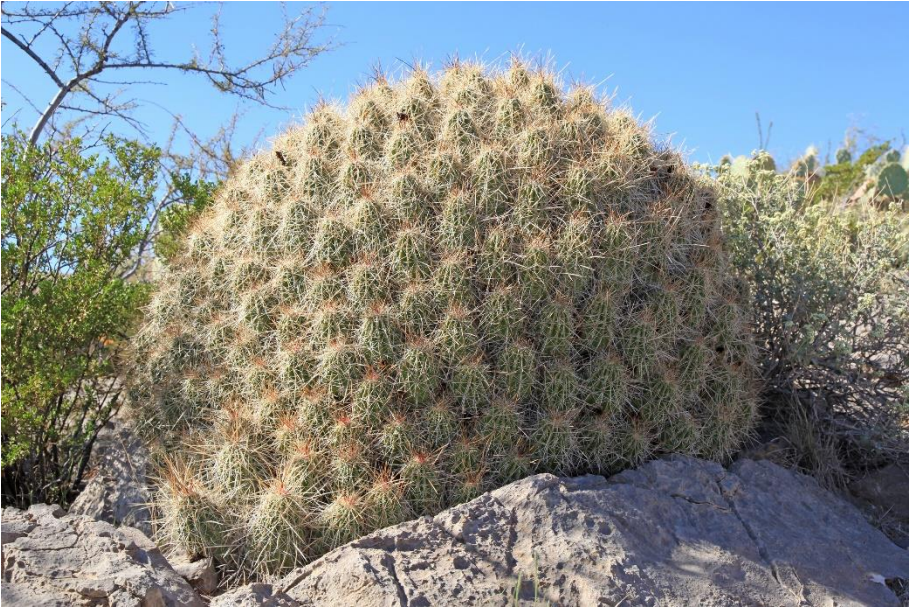
Een cluster Echinocereus coccineus