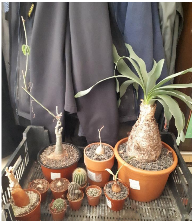
Brunsvigia josephinae (rechts) meteen na aankoop in februari 2022

Mijn plant heeft zich netjes aan dit schema gehouden. In het voorjaar en de zomer stond