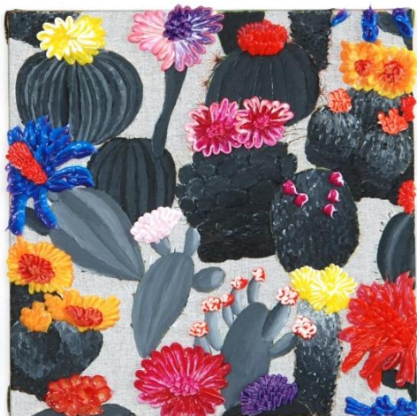
4 Seasons 40 x 40 cm (4 maal)