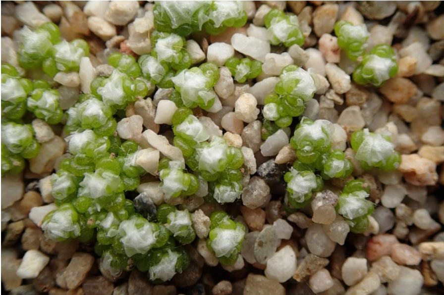
Twee weken later