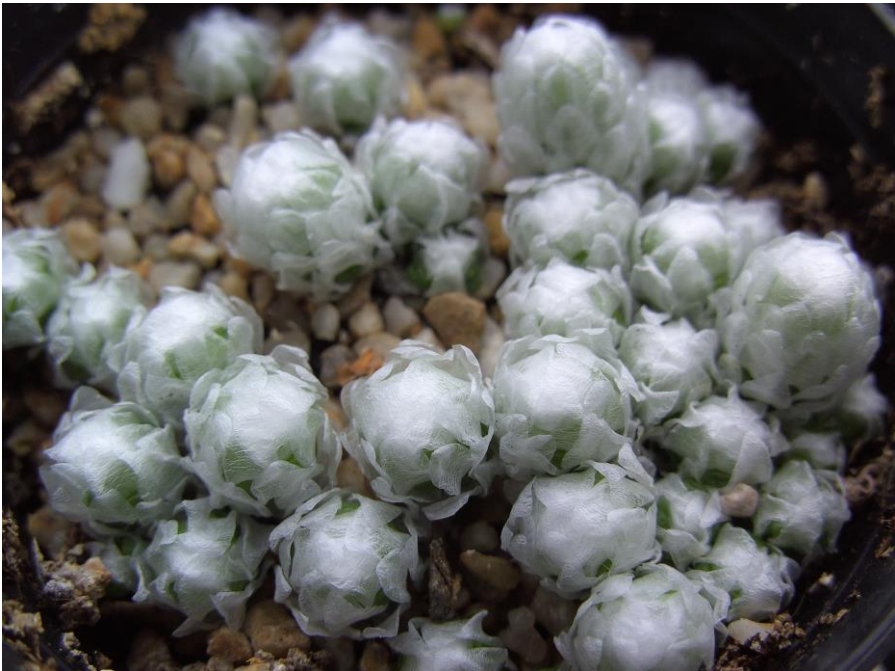
Na circa zes maanden.