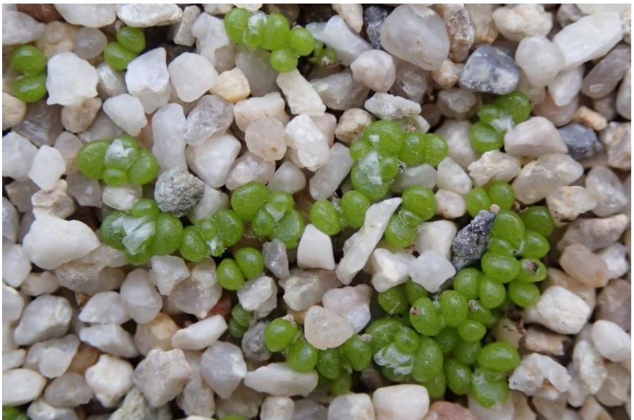
Zeven weken na het zaaien. De eerste wittige schubjes beginnen zich te ontwikkelen.