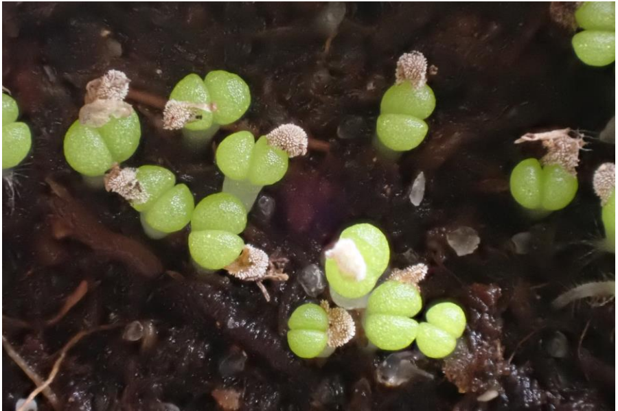
Net ontkiemde zaadjes