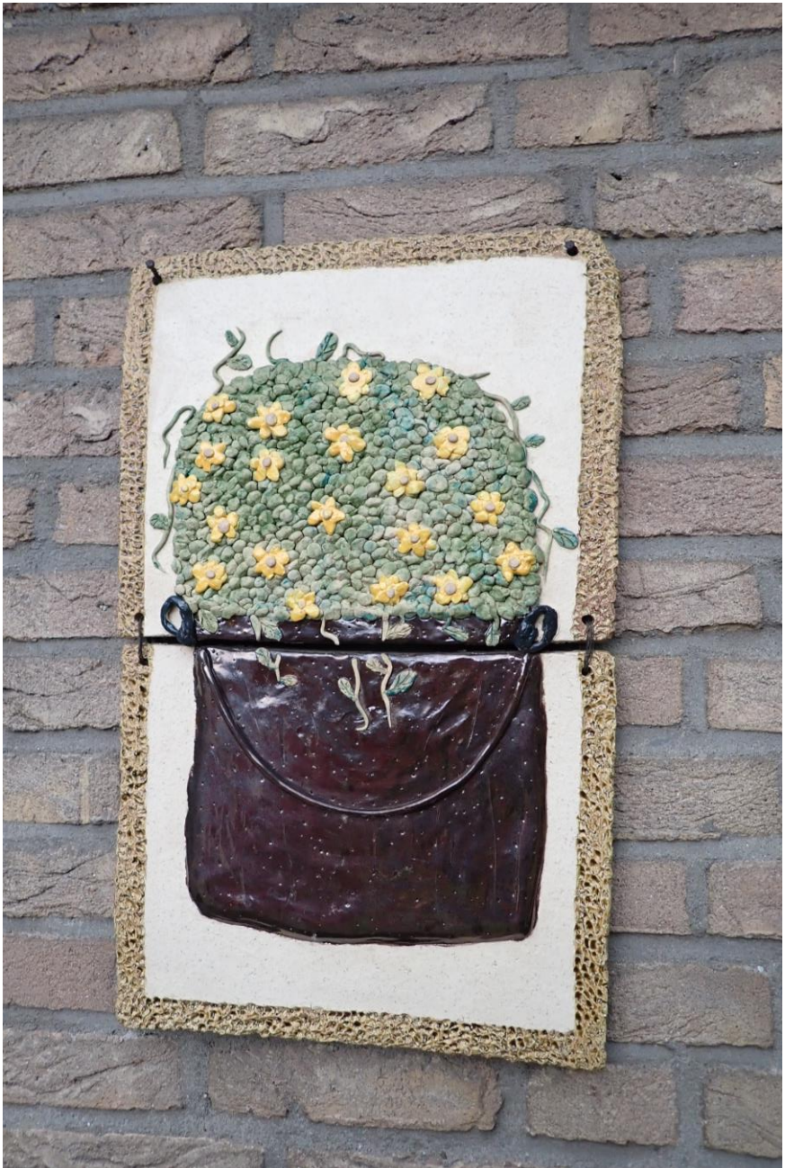
Ook dit fraaie stuk keramiek is door Jan's moeder vervaardigd.