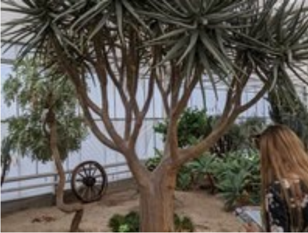
Een grote Yucca

tegenwoordig ook wat spullen van diverse verenigingen. Zo kom je bij binnenkomst meteen een modelspoor tegen met enkele grote Agaves ertussendoor. Ook zijn er hoekjes gemaakt met oude spullen, waardoor het nu deels ook een museum lijkt.