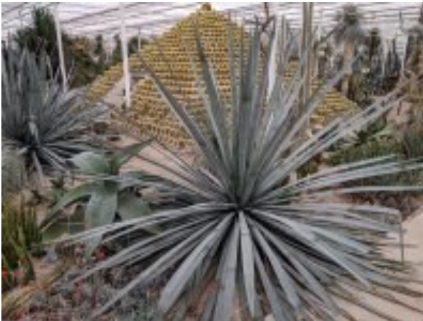
Agave met op achtergrond piramide van Echinocactus grusonii

waardoor ons uitstapje enkele maanden uitgesteld werd. Maar rond de zomer was er nog net iets mogelijk, waardoor wij op midzomer toch eindelijk eens richting Gelderland gingen.