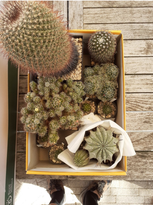
De aankopen van de auteur

no's inkopen voor de verloting. Ach is het voor een tombola? Dan maken we een speciaal prijsje. Dat is natuurlijk erg fijn. Behalve dat we een fijne dag hebben gehad bij fijne mensen met prachtige verzamelingen, hebben we dus ook de verloting rond.