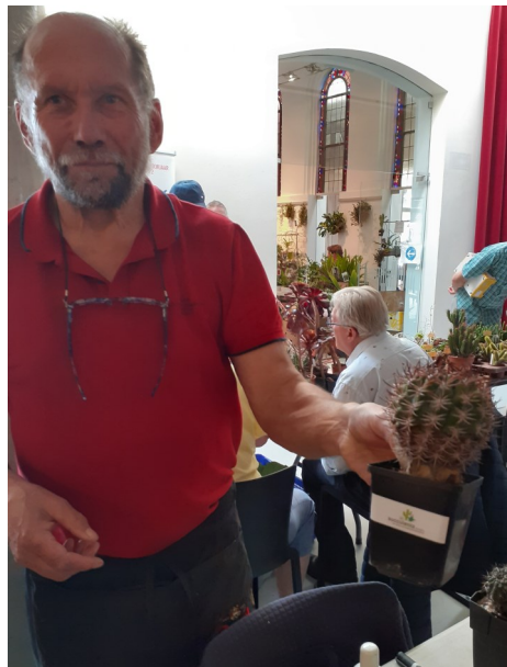
Boudewijn Albert Leopold