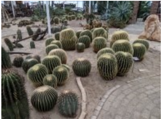
Een groepje Echinocactus grusonii