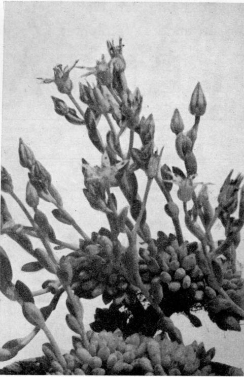
GRAPTOPETALUM PACHYPHYLLUM Rose.