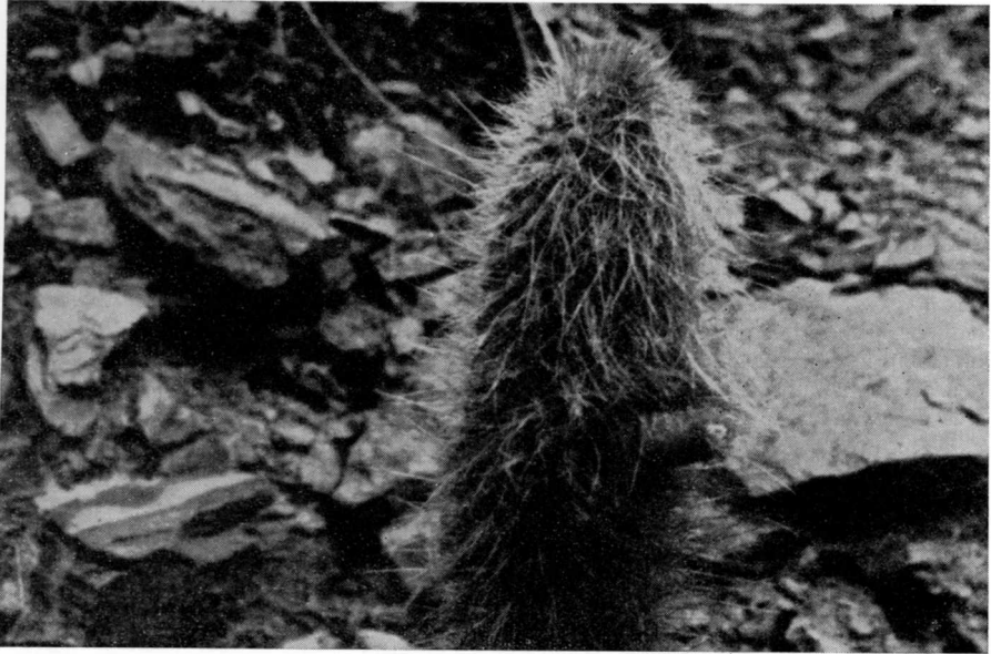
CEPHALOCLEISTOCACTUS CHRYSOCEPHALUS Ritter,