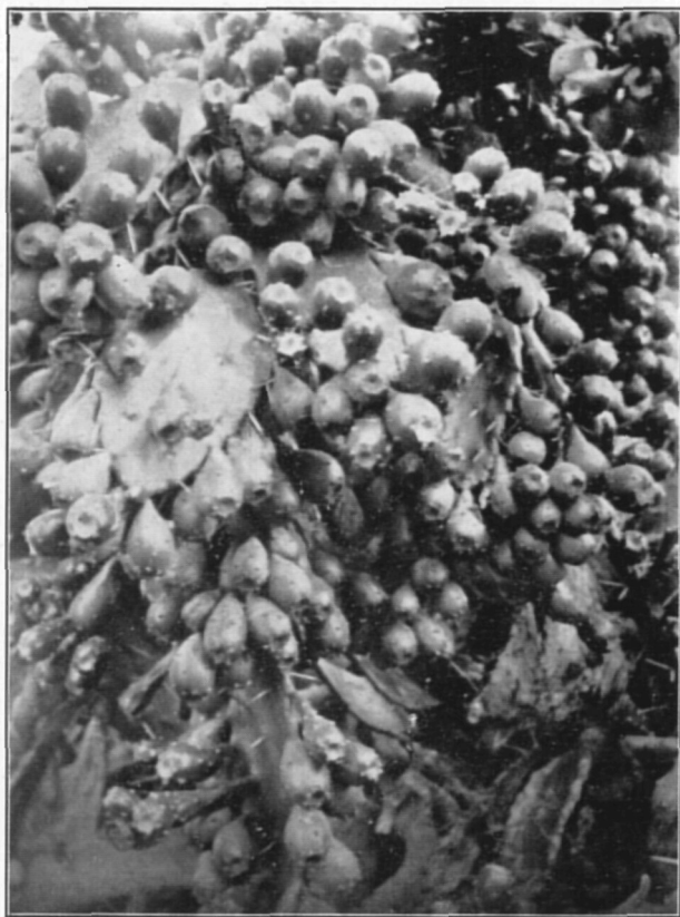
Opuntia monacantha Haw.

Afgebeeld exemplaar van Opuntia monacantha Haw. is opmerkelijk door prolificeerende vruchtbeginsels, d.w.z. die de neiging tot uitbotten vertoonen. Dit verschijnsel komt meer bij Schijfcactussen voor. Vert.