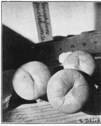
Conophytum percrassum Schick et Tisch. spec. nov.