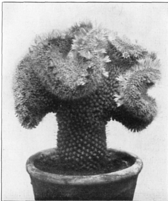
Mamillaria Wildii cristata.

De hier afgebeelde foto is o. i. wel zeer merkwaardig. Het onderste gedeelte der plant vertoont de normale groeiwijze van Mam. Wildii, het bovenstuk is tot een bandvormige groeiwijze (fasciatie) overgegaan.