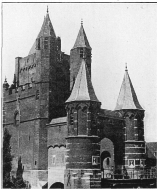
Haarlem, Amsterdamsche Poort.

Zoals bekend mag worden verondersteld, ligt Haarlem in het middelpunt van eene met natuurschoon rijk gezegende streek. Door slechts de als in een krans om Haarlem liggende villadorpen Velsen,