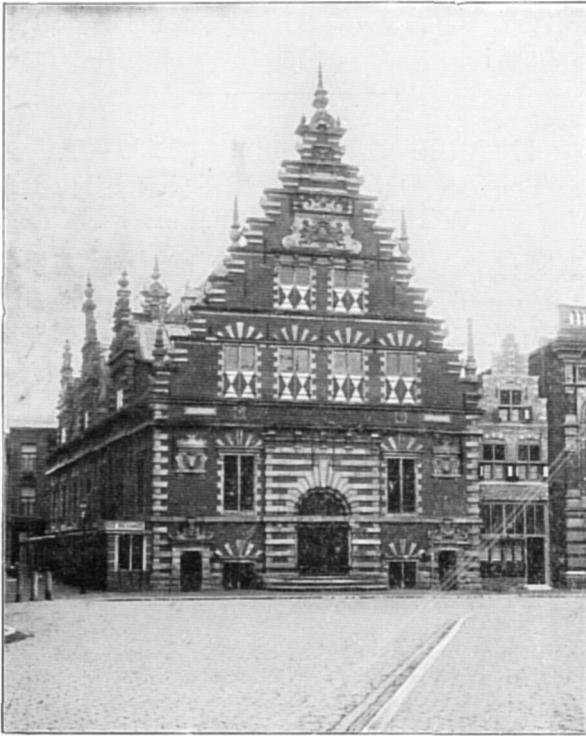
Haarlem, De Vleeschhal.

De stad zelve heeft echter ook hare groote bekoring en voor elck wat wils. Nog altijd is de Groote Markt, in het midden der