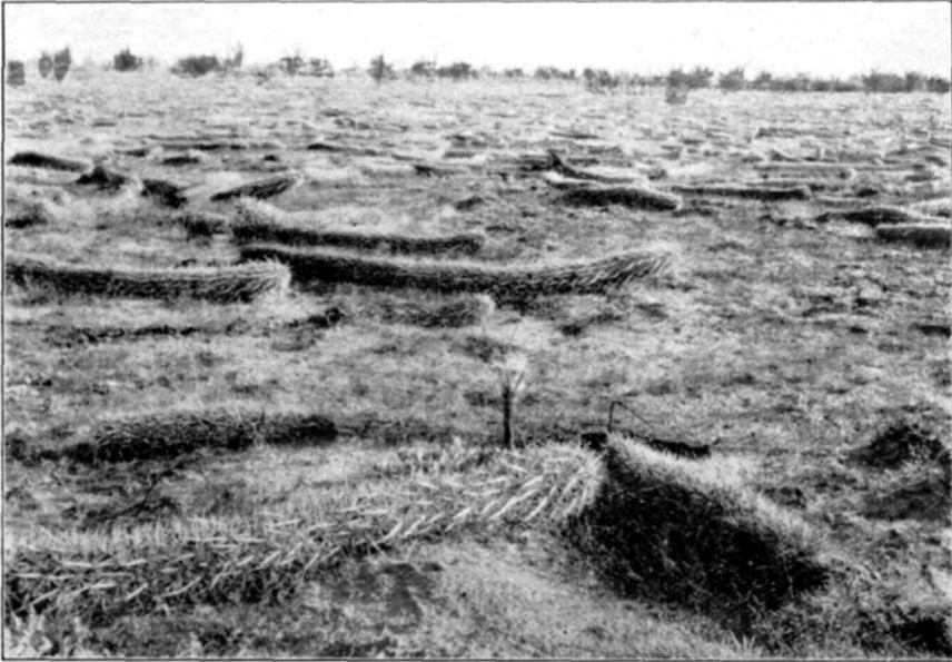
Afb. 2. Vegetatie van Cereus eruca in Neder-Californië. Op den voorgrond een exemplaar in bloei.

Verrukkelijke Mamillaria's, zooals M. (Bartschella) Schumanni heft haar prachtige bouquets, nog nauwelijks door een menschenoog beschouwd, tot de zon omhoog. Zeer opvallend is