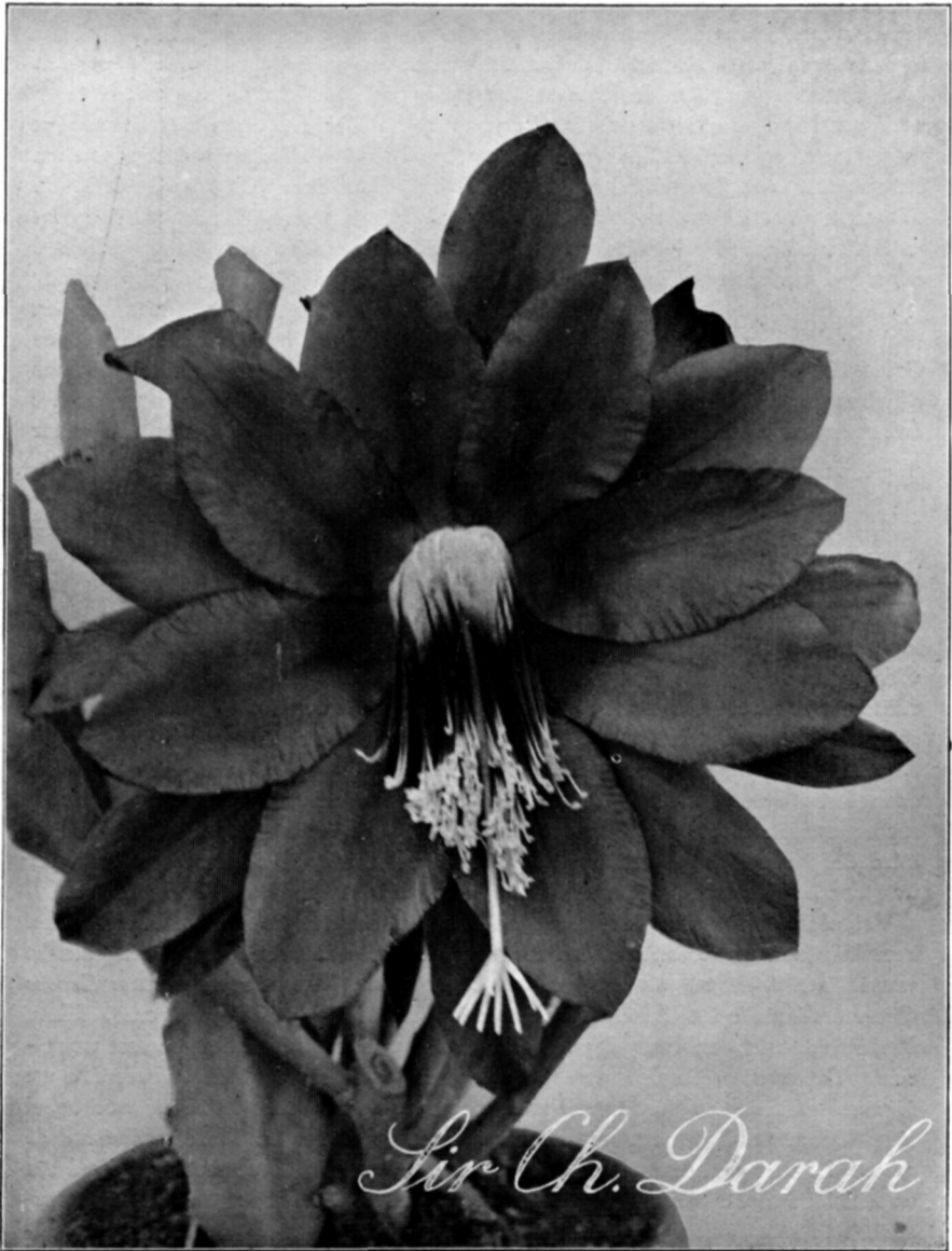
Phyllocactus hybr. „In Memory of Mr. Charles Darrah“

(Cliché bereidwillig door firma Ballego te Leiden ter onzer beschikking gesteld.)