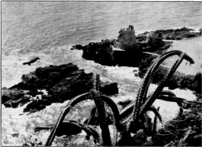
Afb. 1. Kust van den Grooten Oceaan met Cereus occidentalis .

Een heerlijken aanblik geeft echter het uitzicht op den Grooten Oceaan, daar bespoelt in de kleurrijke bochten de schuimende branding de lange slangvormige ranken van Cereus occidentalis . (afb. 1).