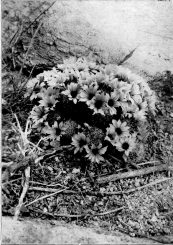
Afb. 3. Mamillaria Schumanni .

Californië is een hoofdzaak nog een jong gebied, dat nog steeds doorgaat zich uit de Oceaan omhoog te heffen. Kustafzetting met schelpenresten vormen het grootste bestanddeel van het land, tot op 200 meter boven den zeespiegel. Tijdens deze opheffing uit de zee moet de hakiggedoornde Mamillaria met de Ferocactus daar zijn terecht gekomen, zooals zij zich nog heden te midden van een aantal andere Cactussoorten bevinden. De Ferocactus-