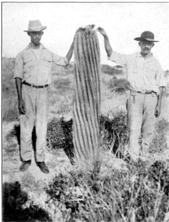
Afb. 4. Echinocactus Santa Maria aan de Kust bij Rancho Ballena. Neder-Californie.

terug, wanneer men van den buitenkant der groeiplaatsen meer naar het centrum gaat. In ieder geval vindt men genoeg tusschenvormen, welke geen hybriden, doch overgangsvormen tusschen soorten zijn. Wilde men dit tot in bijzonderheden nagaan, zoo waren uitgebreide reizen met veel verzamel materiaal noodzakelijk. Steeds zend ik een aantal Mamillariamonsters met nauwkeurige