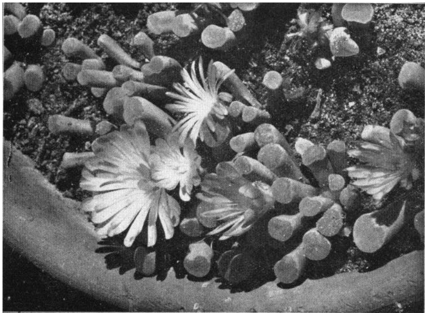
Bloeiende Frifhia pulchra van dichtbij gezien. „Detailopname“.

gezonden (door den Hortus Botanicus te Amsterdam) een Certificaat van Verdienste verkreeg? Zelden heeft men schooner bloemen gezien op zulke bescheiden planten.