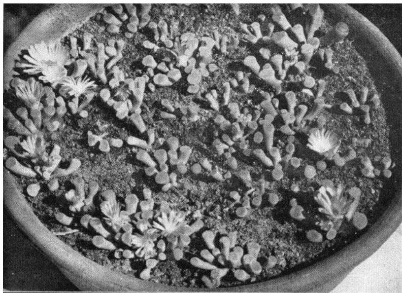
Zaaipan met Frithia pulchra N. E. Br.

De natuur is rechtvaardig ; als zij aan de mooie meisjes minder hersenwindingen geeft dan aan de leelijke, dan vinden we dit billijk. In de plantenwereld is zij het steeds. Planten, zooals de Frithia's , die door de omstandigheden de luxe van een weelderigen groei hebben moeten ontberen, geven bloemen zóó groot, in vergelijking met de afmetingen van de plant zelf, en zóó schoon van kleur en vorm, dat zij wedijveren met vele planten en boomen, die duizenden malen hun omvang hebben.