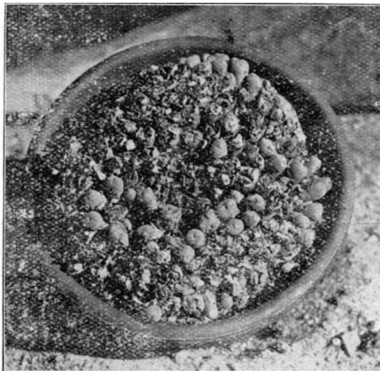
Conophytum elongatum Schick et Tisch. Nat. grootte.

zeer weinige in een capsula, 1/4 - 3/4 m.M. lang, licht-houtkleurig met wat donkerder, tamelijk langen navel.