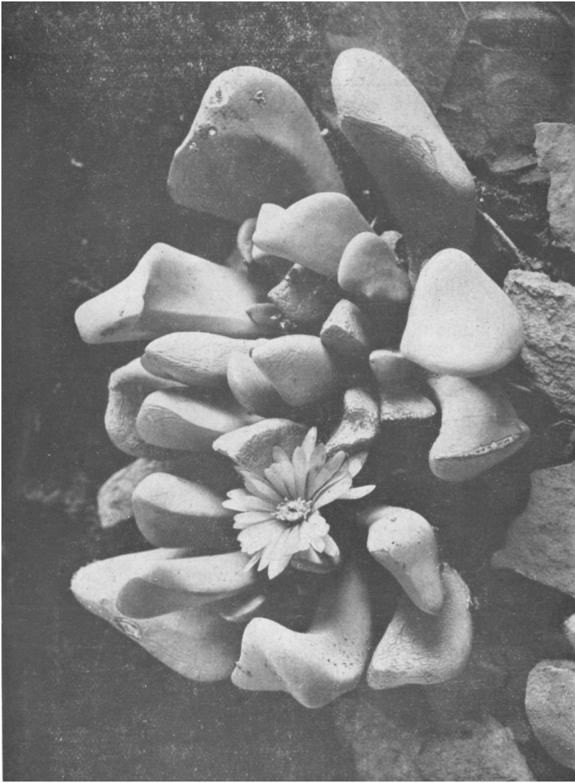
Mesembryanthemum tigrwelliae L. Bolus.