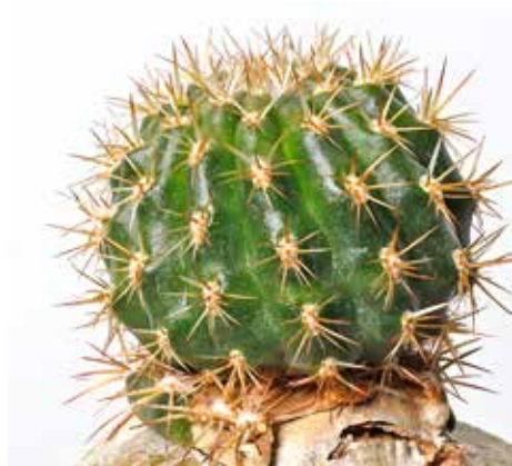
Lobivia cv. Henk