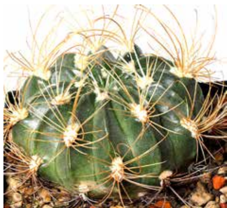
Lobivia chrysothele var. subtilis