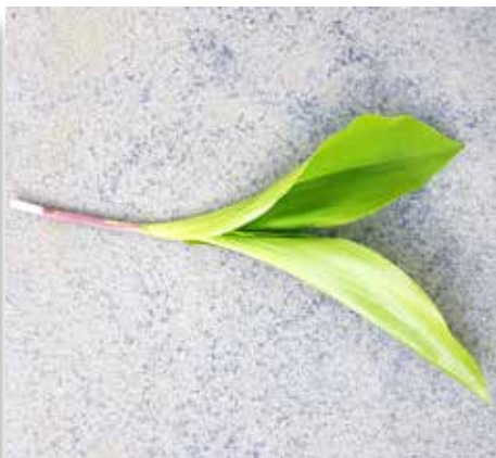
Blad lelietje van dale