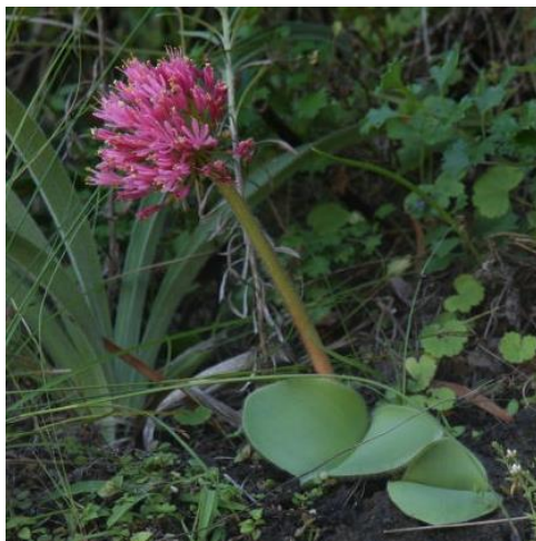
Afb.17 Haemanthus humilis subsp. humilis

Een paar jaar geleden heb ik een collectie Haemanthus planten gekocht. Het bijzondere is dat in de collectie ook enkele planten H. humilis subsp. humilis met de aanduiding ‘Thomas River’ stonden. Ze hebben ondertussen gebloeid. Als ik de bloemen en de bladeren vergelijk met die op mijn foto’s dan lijkt het er erg sterk op dat mijn planten afkomstig zijn van deze locatie.