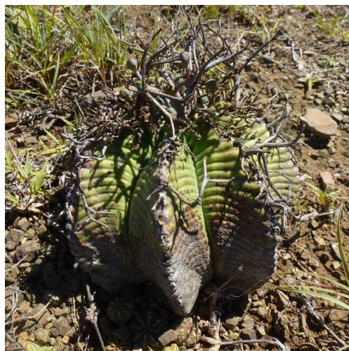
Afb.12 Euphorbia meloformis