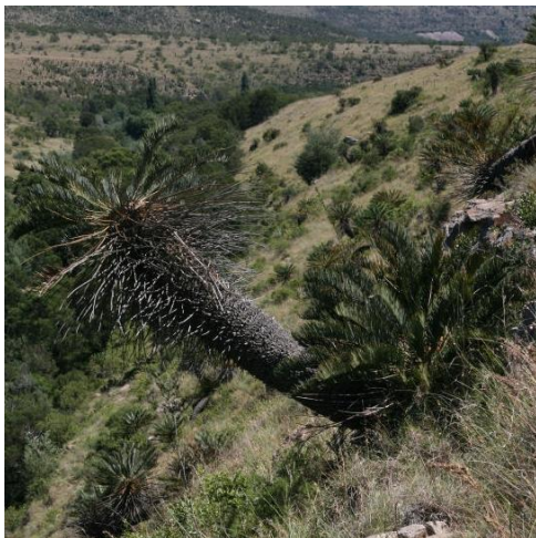
Afb.16 eeuwenoude Cycas

was daar niet de juiste plek voor. We hebben meerdere bloeiende H. humilis subsp. humilis planten gezien. Ik kan je verzekeren dat met één hand je camera scherpstellen geen sinecure is. Maar het is (bijna helemaal) gelukt. Als ik erop terugkijk, dan was het eigenlijk gekkenwerk. Goed dat ik het van te voren allemaal niet wist.