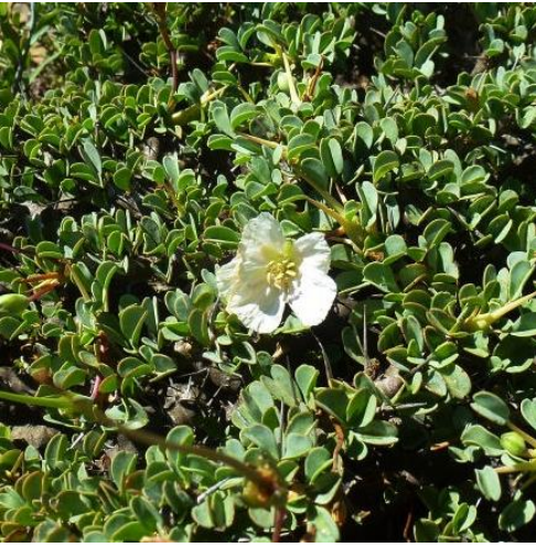
Afb.13 Sarcocaulon vanderrietiae