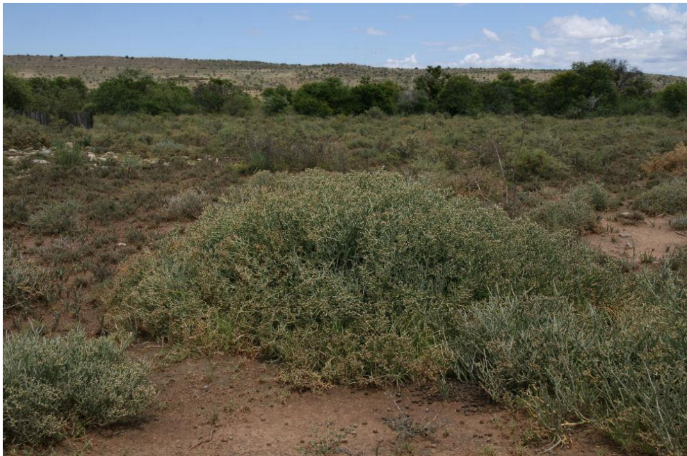
Afb. 15: Euphorbia mauritanica

Linnaeus neemt in zijn beroemde werk ‘Species Plantarum’ uit 1753 de teksten van zijn eerdere werk integraal over.