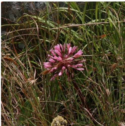
Afb.11 Haemanthus carneus

merken we dit direct. Het gras is hoog en staat dicht op elkaar. De andere planten komen hier met moeite doorheen. We gaan op zoek naar Haemanthus carneus . We vinden op plekken waar het gras minder dik groeit en op open plekjes enkele bloeiende planten.