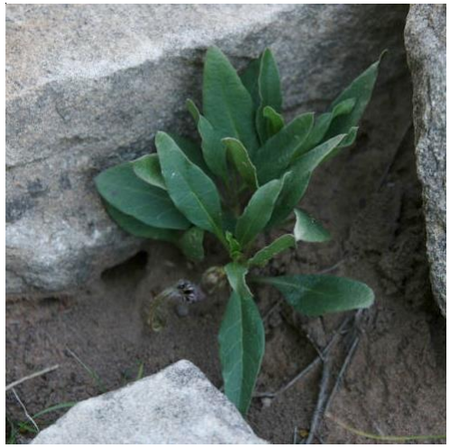
Afb.14 Brachystelma cathcartense