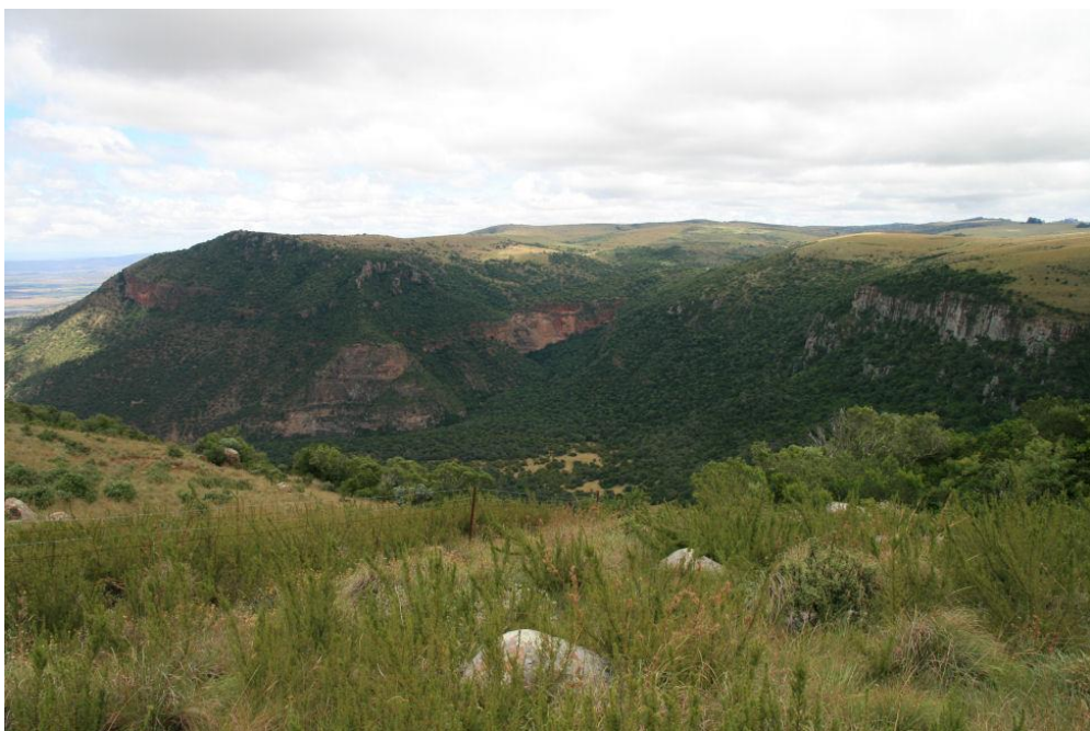
Afb. 10 Uitzicht vanaf de Boschberg

Somerset East ligt aan de rand van de Karoo. In de dalen is het droog met een succulente vegetatie. Deze wijzigt als je de heuvels inrijdt. Mijn tocht gaat naar de Boschberg. In het dal is het zonnig. Bovenop de berg is het mistig. Het is nog vroeg in de ochtend en Cameron vertelt dat het in de loop van de ochtend wel zal optrekken. Ondanks het weer is het een mooie tocht.