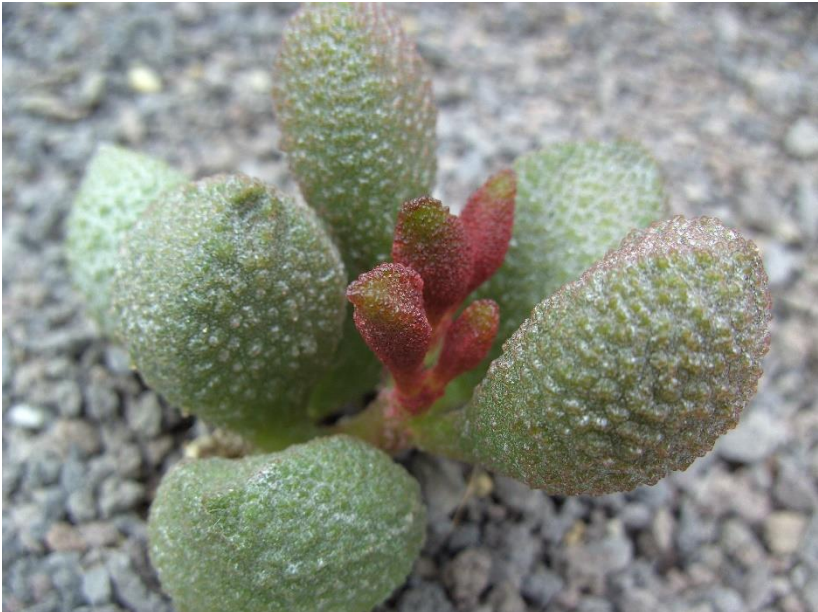
Adromischus marianiae subsp. herrei