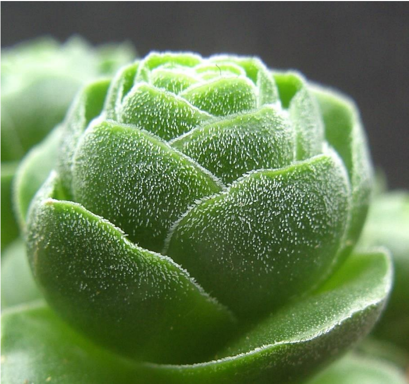
Crassula 'Emerald' (= C. barklyi x susannae )