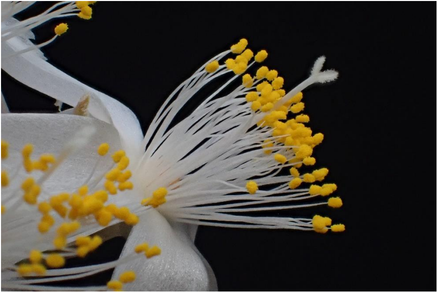
Bloem van Avonia quinaria subsp. quinaria (onder) en van A. quinaria subsp. alstonii .