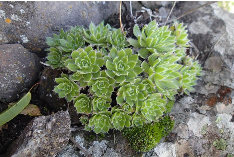
Aeonium simsii op Gran Canaria