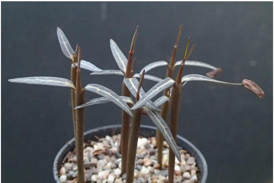
Jonge zaailingen van Ceropegia fusca