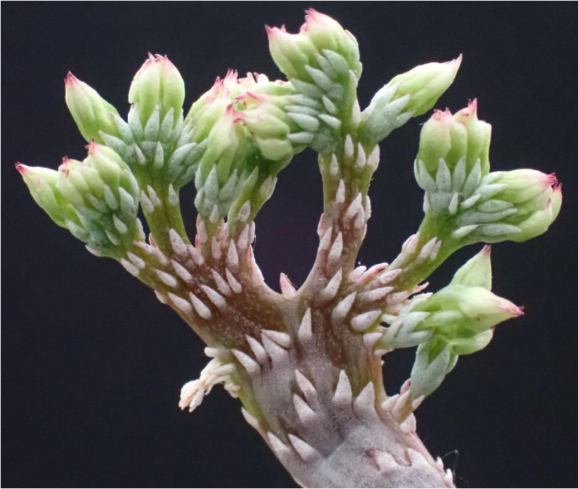
Bloemstengel van Adromischus cristatus var. clavifolius