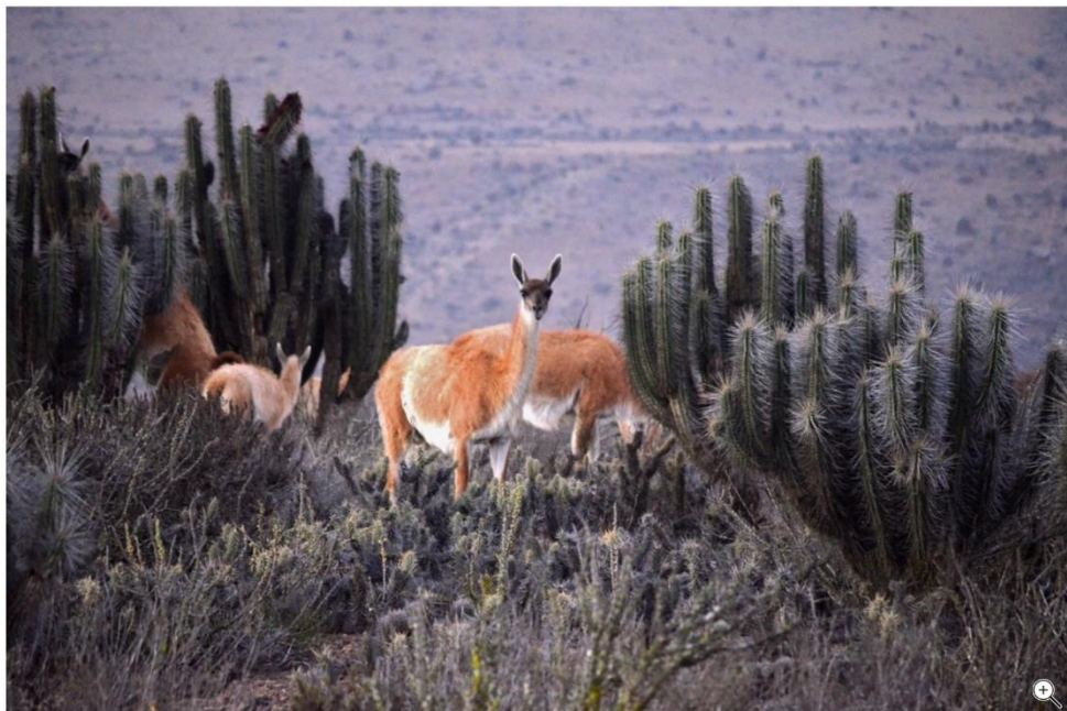
GUANACO'S, VERWANT AAN DE LAMA, IN DE ATACAMA-WOESTIJN IN NOORD-CHILI, WAAR EEN NIEUWE IJZER- EN KOPERMIJN WORDT AANGELEGD.

OOGCONTACT ■ LA HIGUERA, CHILI ■ 5 OKTOBER 2021