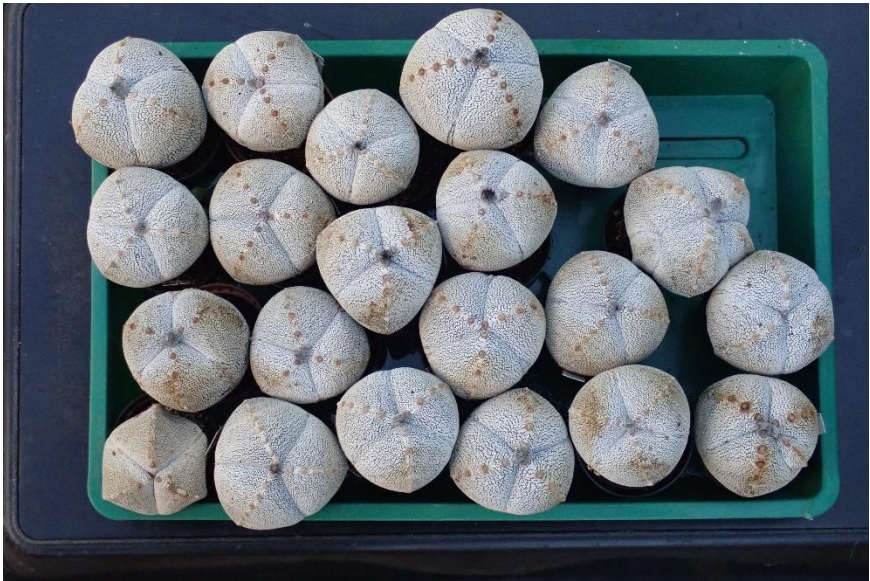
Astrophytum myriostigma 'Onzuka' met 3 ribben in 6,5 cm potjes