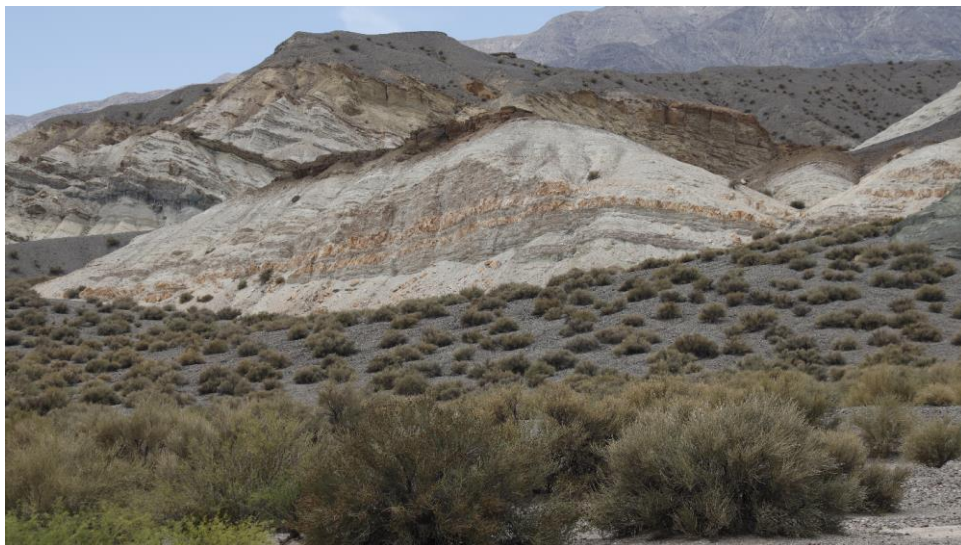
Adembenemende landschappen in Argentinië