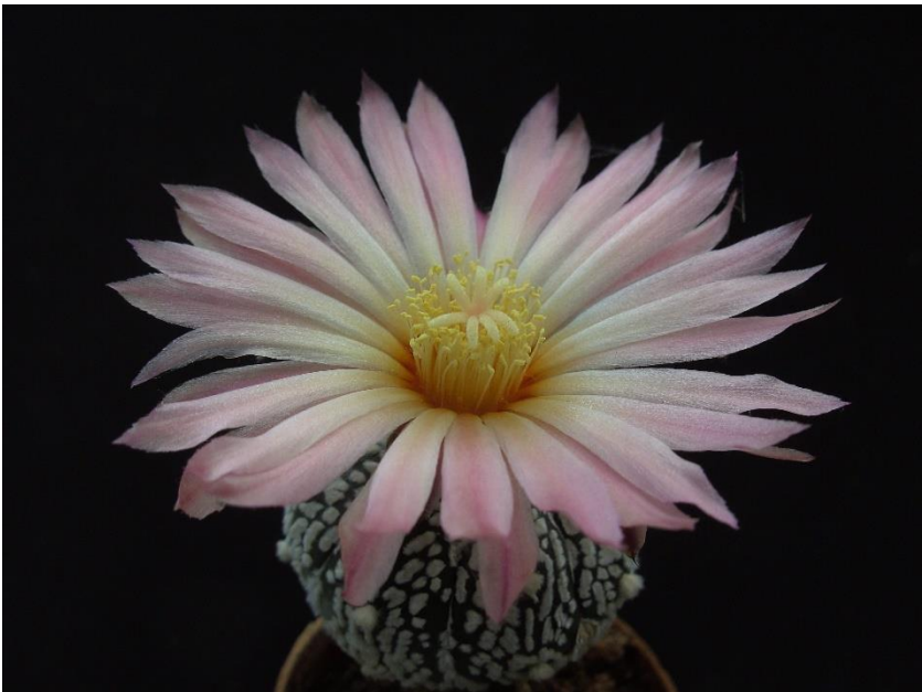
Astrophytum asterias 'Superkabuto' in bloei