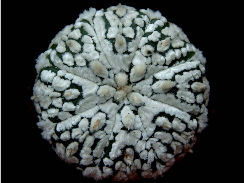
Astrophytum asterias 'Superkabuto'