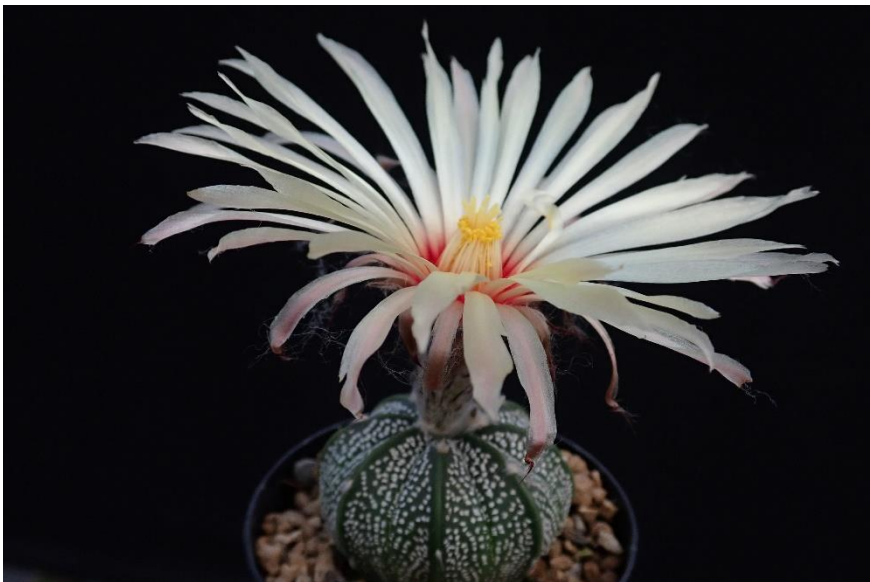
Een astrophytum hybride in 6,5 cm potje met zeer grote bloem