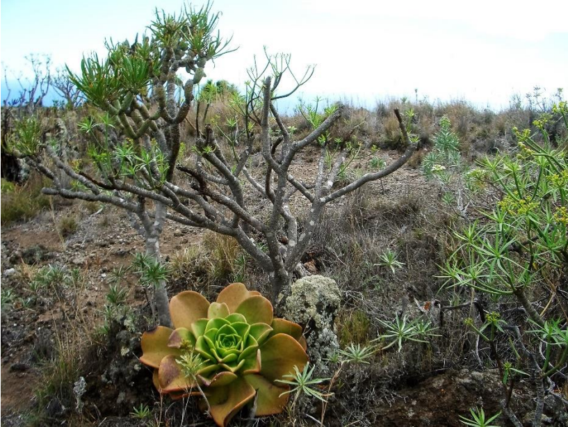
Aeonium nobile op La Palma. Op de achtergrond Senecio kleinia . en rechts een euphorbiastruik (vermoedelijk E. lamarckii )