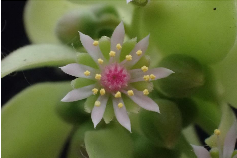
De bloem van Aeonium goochiae