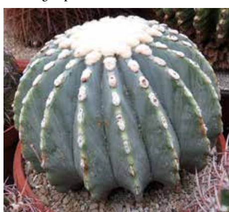
Ferocactus glaucescens fa. inermis