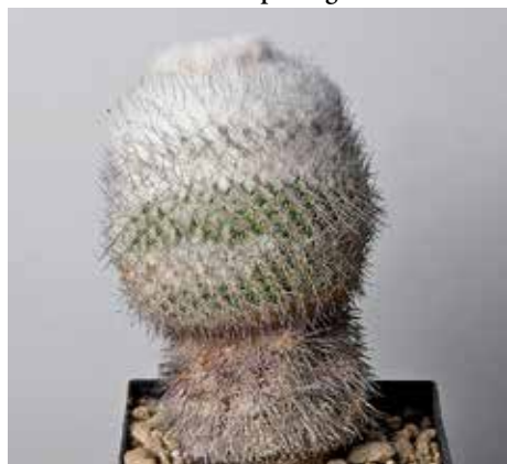
Epithelantha micromeris ssp. unguispina