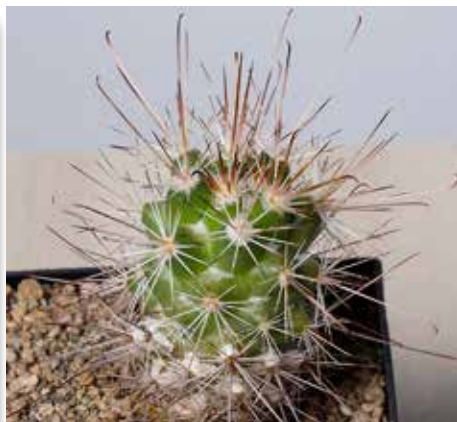
Cochemiea (Mammillaria) maritima