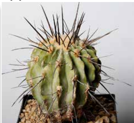
Copiapoa dealbata var. deminuta