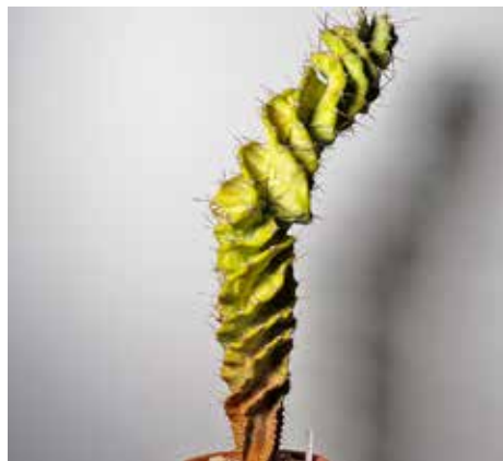
Cereus forbesii cv. spiralis