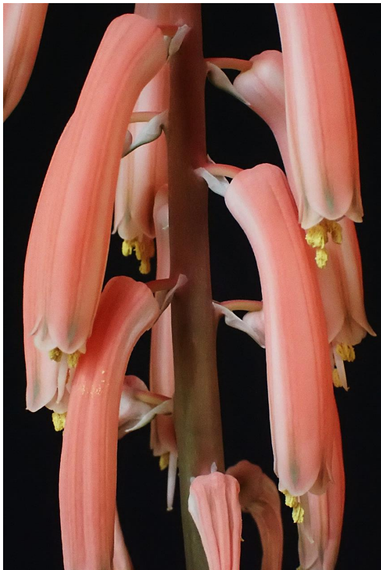
De patrijsveeraloë, Aloe variegata in bloei eind januari 2021