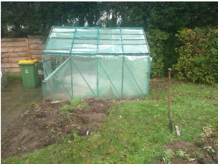
Het oude kasje.

Al in mijn studententijd had ik interesse in mesems en kweekte op de vensterbank van mijn Wageningse studentenkamer een bak met Lithops . Helaas had mijn aardige buurmeisje een kat die op een onbewaakt moment de Lithopsbak als kattenbak beschouwde. Dit was het begin van een langdurige pauze in de hobby want later was de tuin te klein voor een hobbykas. Pas in 1993 na verhuizing naar een woning met grote tuin kwam een kas in beeld. Op dat moment had ik mij nauwelijks georiënteerd op kassengebied en had mij een 2 x 2,5 m exemplaar aangeschaft wat op het eerste gezicht wel wat leek. Schijn bedriegt, het was eigenlijk rommel. De 0,5 cm dikke kanaalplaat liet na een paar jaar door verkleuring minder licht door, werd brokkelig en de deur viel er regelmatig uit of uit elkaar. De polycarbonaat beglazing werd vrij snel gelig en na 6 jaar ook brokkelig en deels vergaan onder invloed van uv licht. Sommige panelen waren geheel verdwenen en moesten vervangen worden door kasfolie. Er stond al jaren niets van botanische waarde in omdat er eigenlijk geen collectie in te houden was.