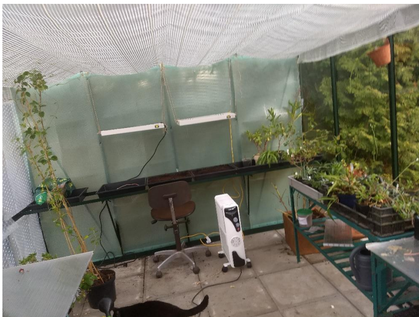
Achterwand met oa zaaibakken, verlichting, elektrische kachel en schermdoek.