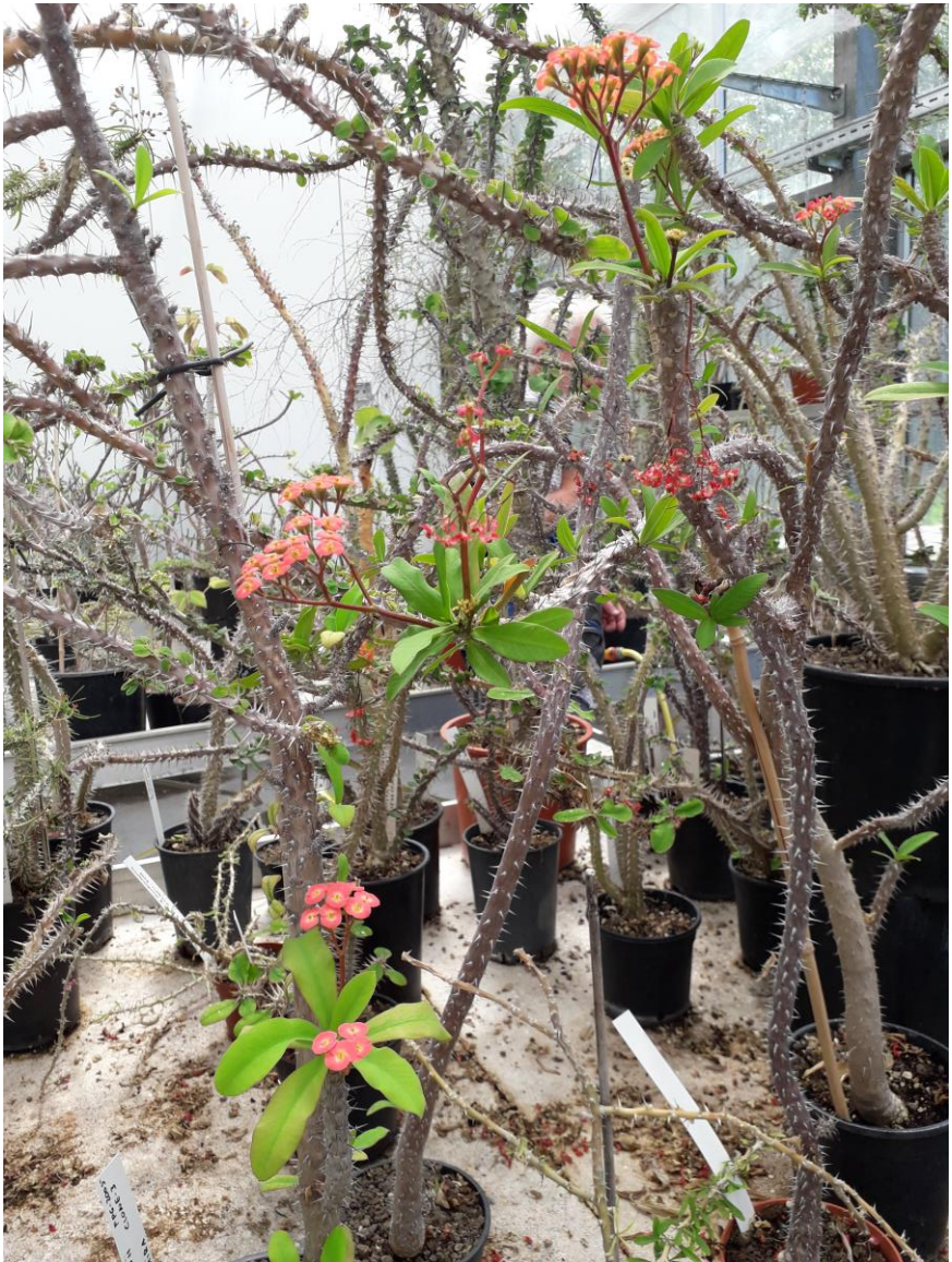
Euphorbia milii beuginii