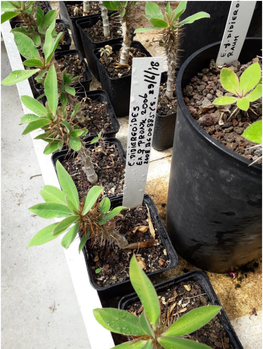
Euphorbia didiereoides