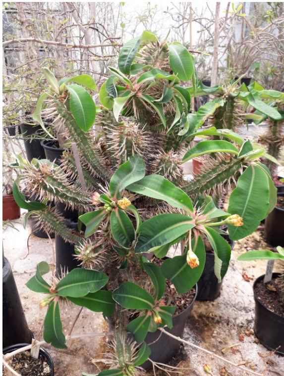
Euphorbia viquieri v. capuroniana

De kas in het Gimborn arboretum staat in een hoekje aan het einde van de tuin. We gingen er