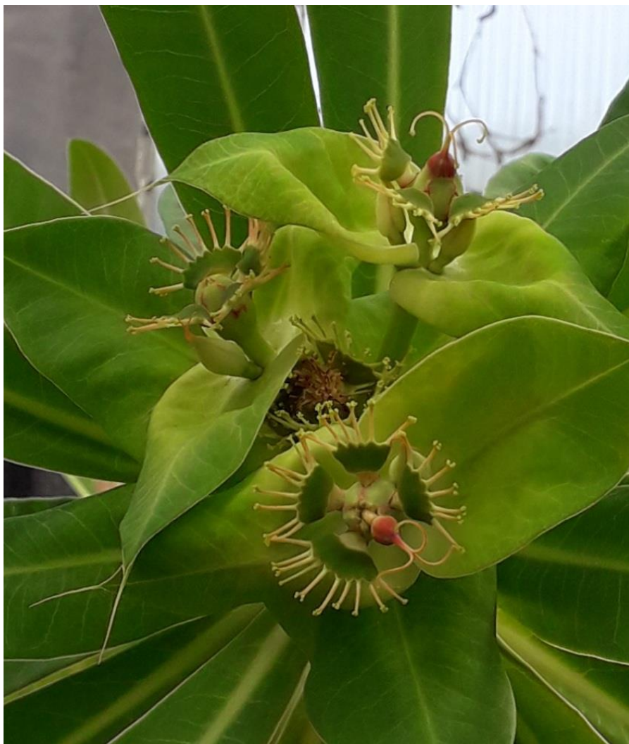
Euphorbia friesiorum in het Gimborn arboretum