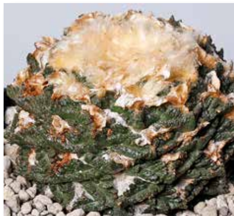
Ariocarpus fissuratus x godzilla