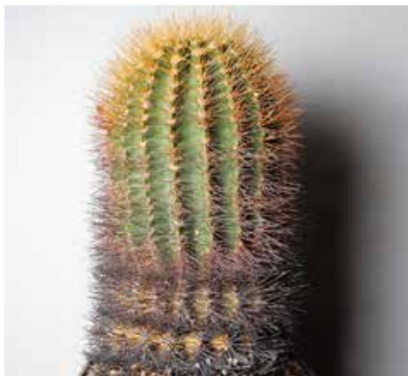
Acanthocalycium spiniflorum var. violaceum